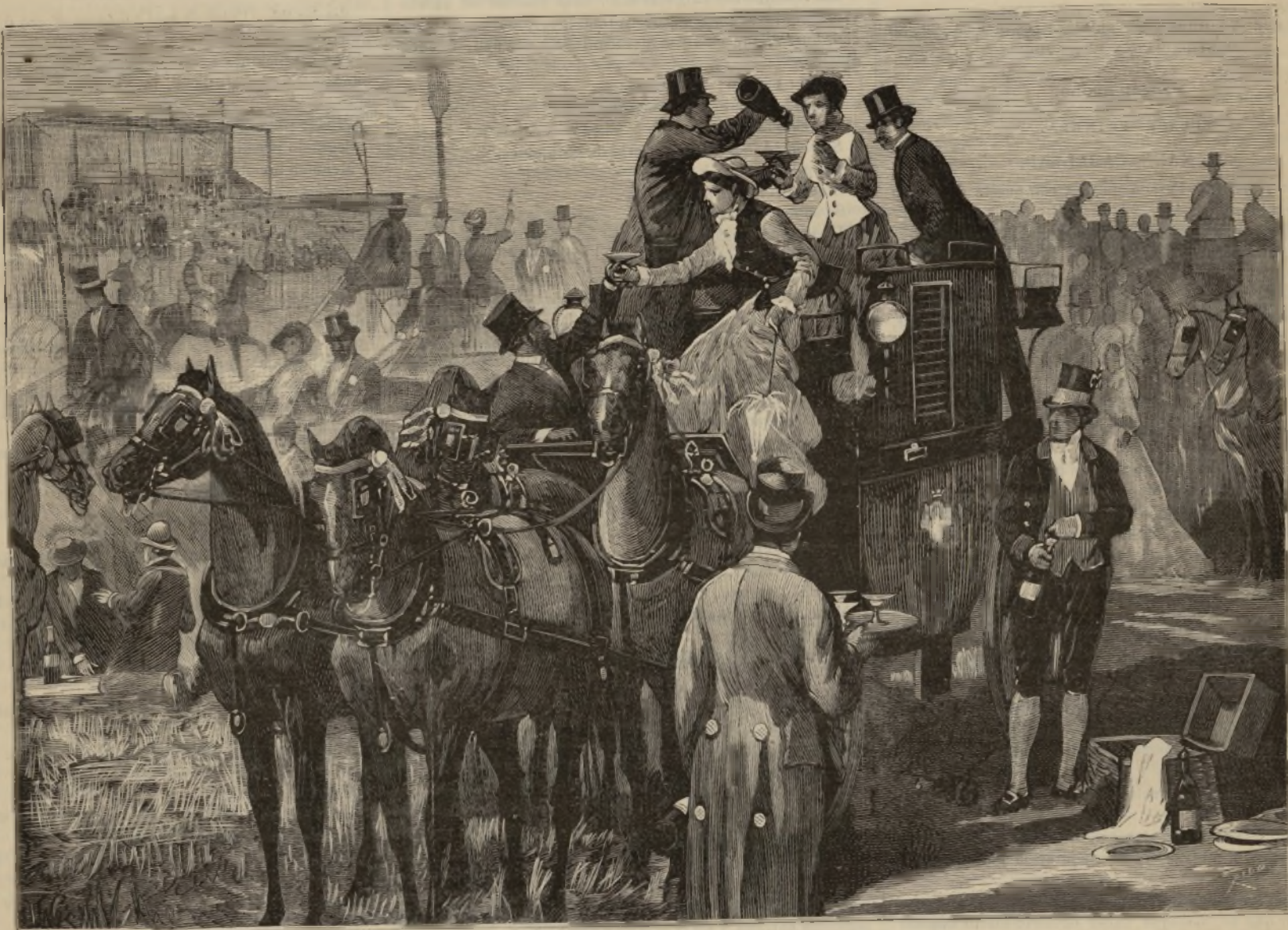
EL «DESCANSO» EN LAS CARRERAS.

Se creyó en un principio que cuatro días de