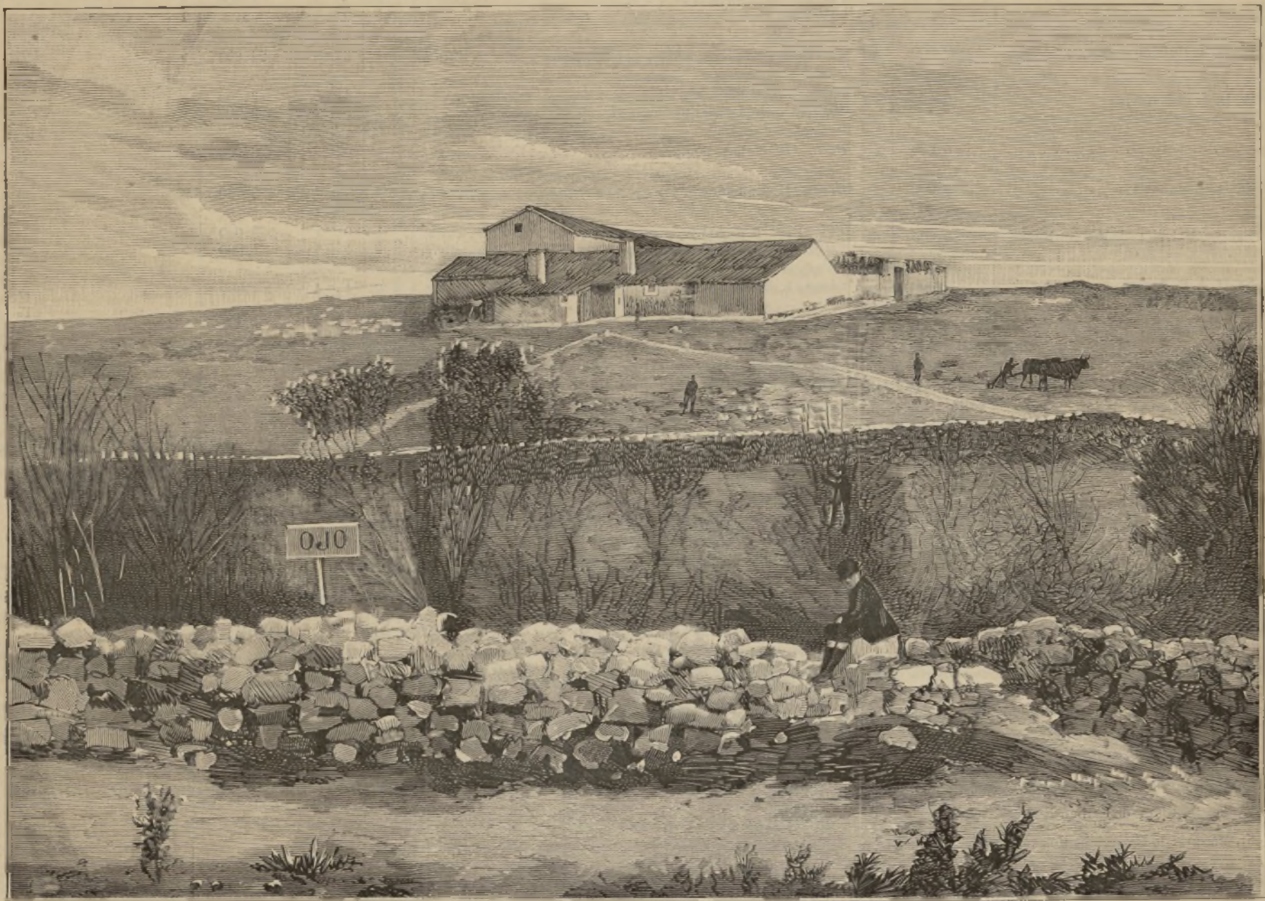
Colonia agrícola de «PRADO LARGO y TIRVIEJO», flaca de secano mejor cultivada, premiada en el concurso celebrado por decreto del Ministerio de Fomento.

La raza holandesa es, como lechera, la mejor del mundo; pero téngase presente, para no incurrir en error, que en Holanda hay tres variedades que residen principalmente, por su orden, en Frisa, Groninga, y en la parte septentrional; en Celandu y en la Flandes holandesa; y en Drecht, Utrecht y Gueldre. Las Noord-holandesas son las mejores. Su longitud es de dos metros; producen ordinariamente