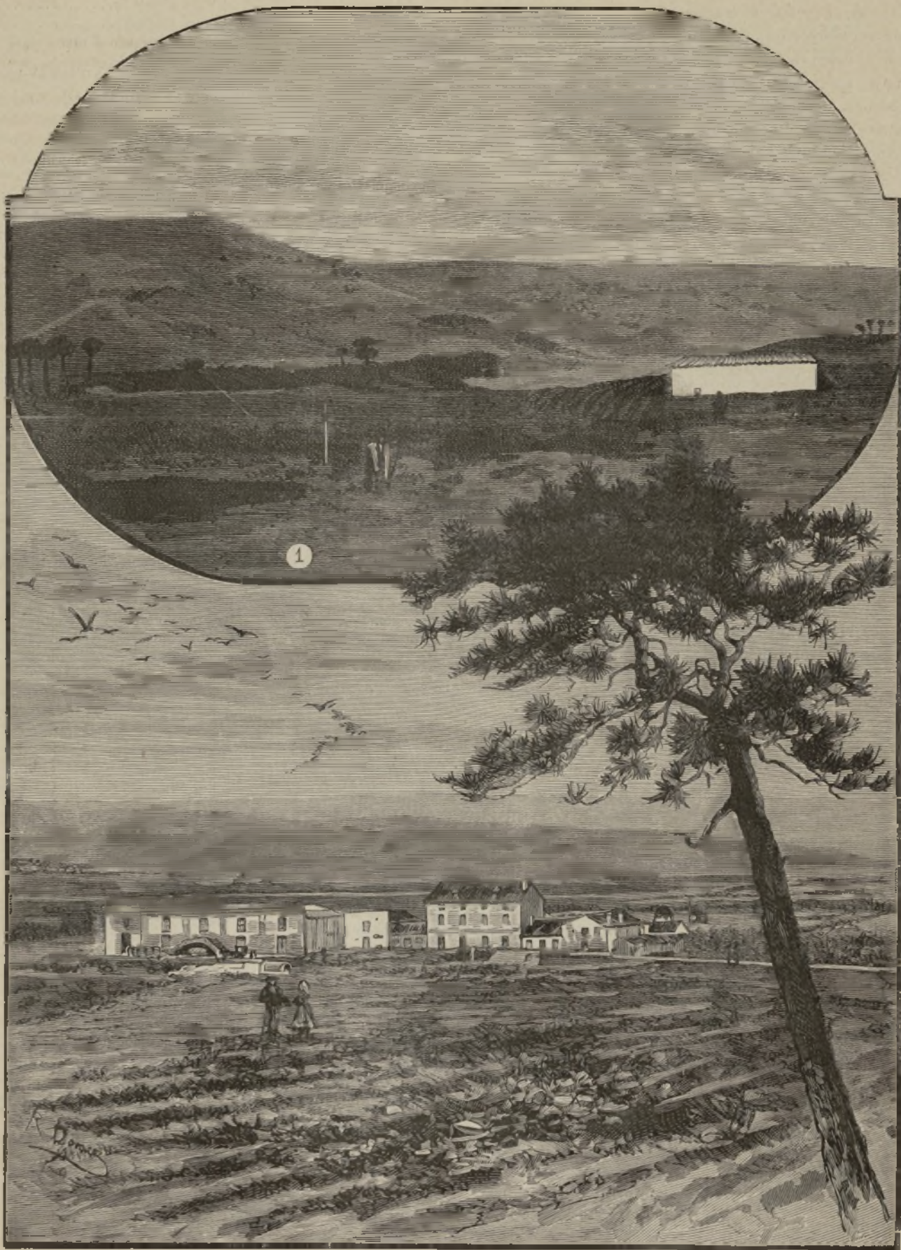
«VEGA DE SICILIA Y CARRASCAL», premiada en el concurso celebrado por decreto del Ministerio de Fomento.

Adviértese que, en medio de los grandes contratiempos que sufre la clase ganadera, ora por efecto de las leyes aduaneras, ora por la transformación de la propiedad en España, hacen algunos laudabilísimos esfuerzos por evitar que llegue este ganado á una ruina general y perpetua. Afortunadamente se alcanzan resultados satisfactorios, según lo demuestra la comparación de este Certámen con la expuesta en años anteriores. Se nota que la emulación es igual en el grande que en el molesto ganadero, por lo cual merecen también por igual el parabién de la patria el magnate, que, robando el tiempo á tareas de otra índole, dedica su atención á la mejora de este ramo de producción, y el oscuro pobre ganadero que instintivamente comprende que el aumento de su escasa fortuna y el bienestar de su familia crecen en proporción del esmero que dedica á la administración de su capital pecuario.