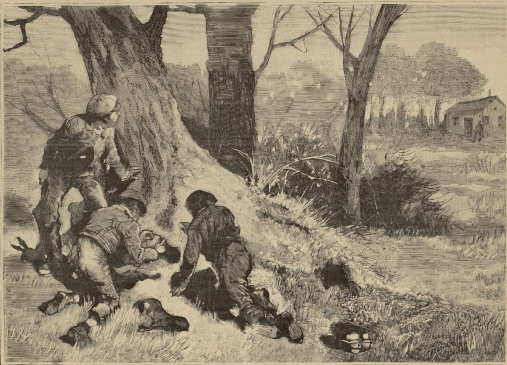
LOS PEQUEÑOS CAZADORES.

Un premio de 2 000 dollars se había propuesto para el caso en que el tiempo empleado por este caballo fuera superior á 2' 14" \frac{1}{2} , y el propietario aceptó. El primer cuarto de milla lo corrió en 34", el segundo en 32" \frac{1}{2} , los tres primeros en 1' 39". Desde este momento, Bittier, que conducía el caballo, lo hizo con una mano, y con la otra sonaba el látigo, sin tocarle: el último cuarto de milla lo corrió en 31" \frac{3}{4} . Un vigoroso hurra acogió aquel resultado; el propietario fué muy felicitado y tuvo que escapar á la ovación que le hacían. Regaló 1.000 dollars á Bittier, y 500 al personal de la cuadra. El carruaje pesaba 52 li-