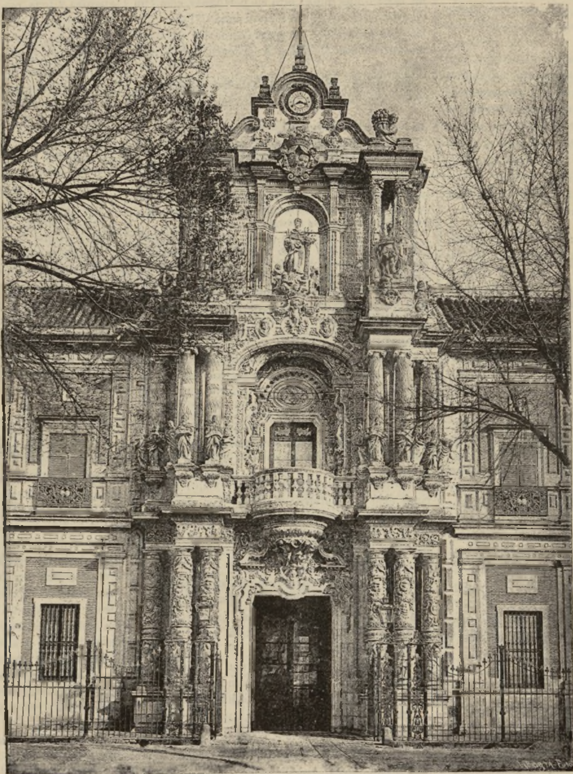
SEVILLA.—PORTADA PRINCIPAL DEL PALACIO DE SAN TELMO.

Hé aquí lo que los periódicos de esta ciudad dicen sobre la estancia del comendador Salvi y sobre el éxito de su conferencia :