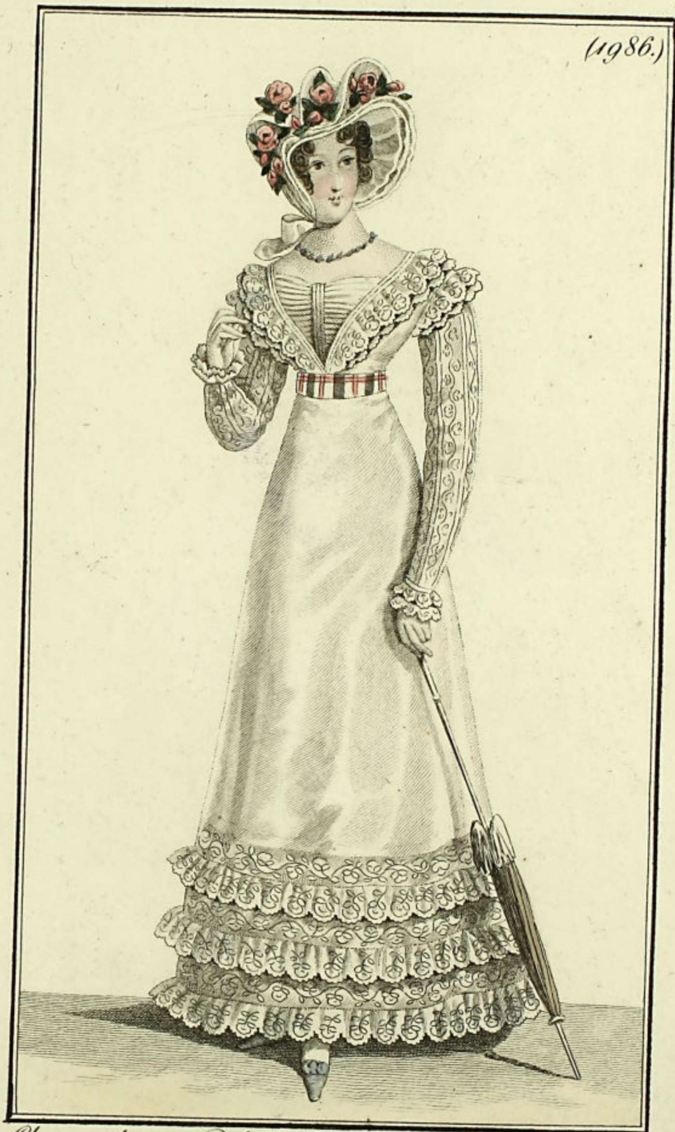
Chapeau de gaze. Robe de mousseline, garnie de volans brodés, avec entre-deux de tulle. dessous de taffetas.