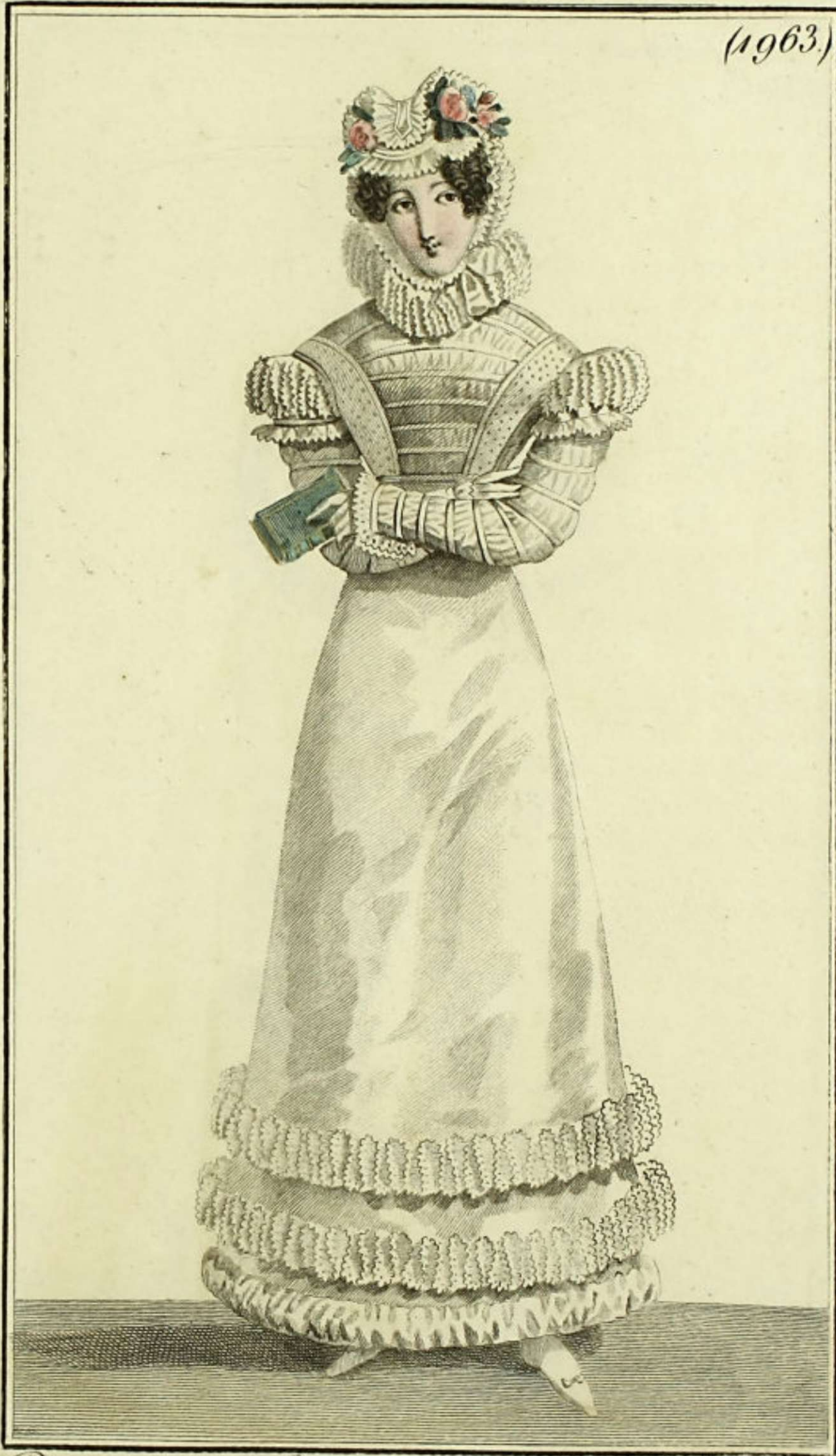
Bonnet de tulle, Canexou de tulle. Robe de satin, garnie de blonde.