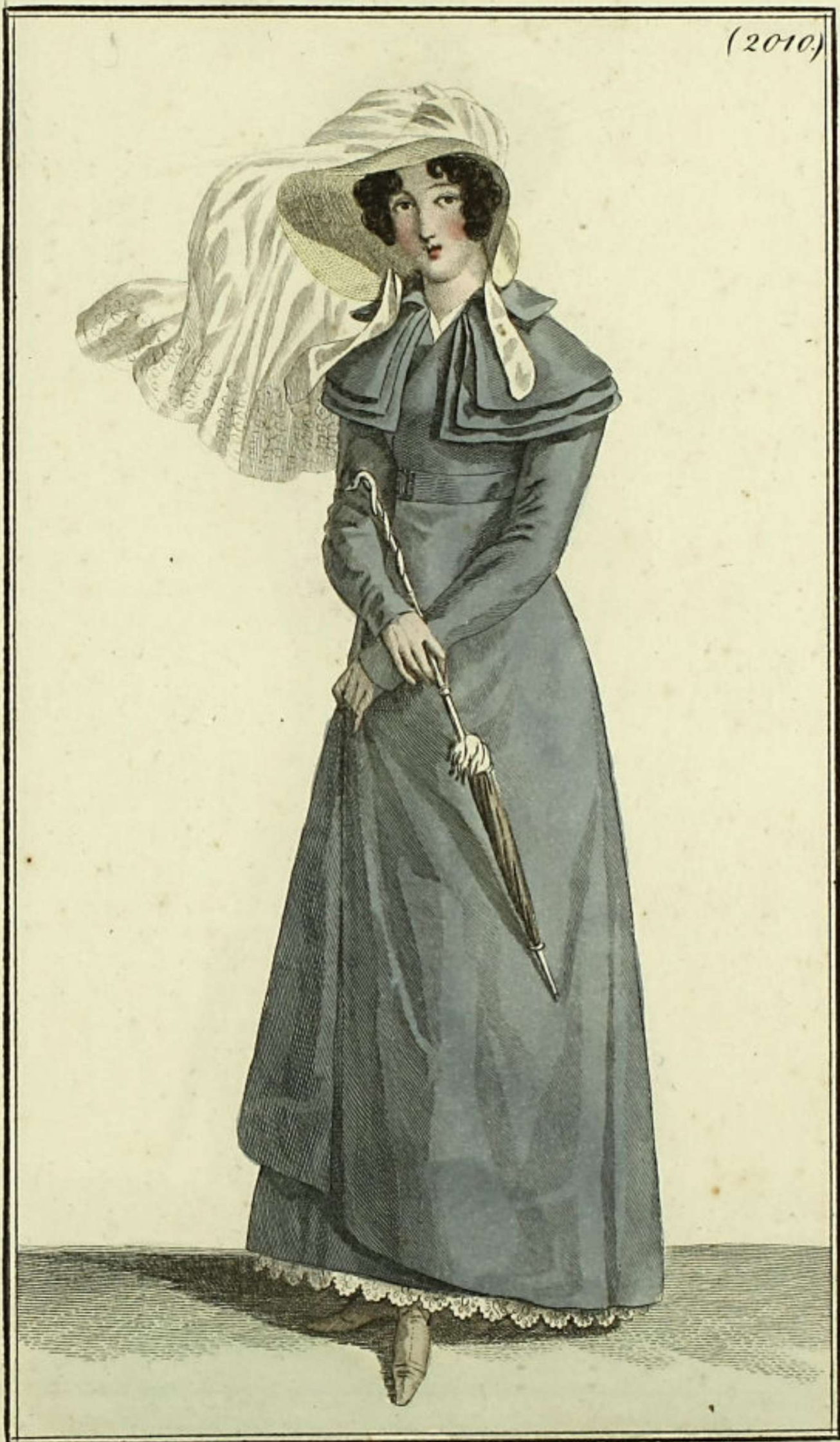
Costume de campagne. Chapeau de paille d'Italie. Voile de gaze brochée. Peignoir à pèlerine en tissu. Guêtres écorues.