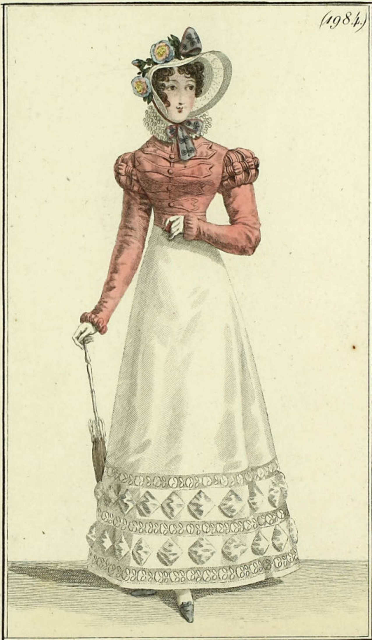
Chapeau de paille blanche, orné de roses couleur d'arc en ciel et de rubans de gaze. Spencer de velours simulé. Robe de percale.