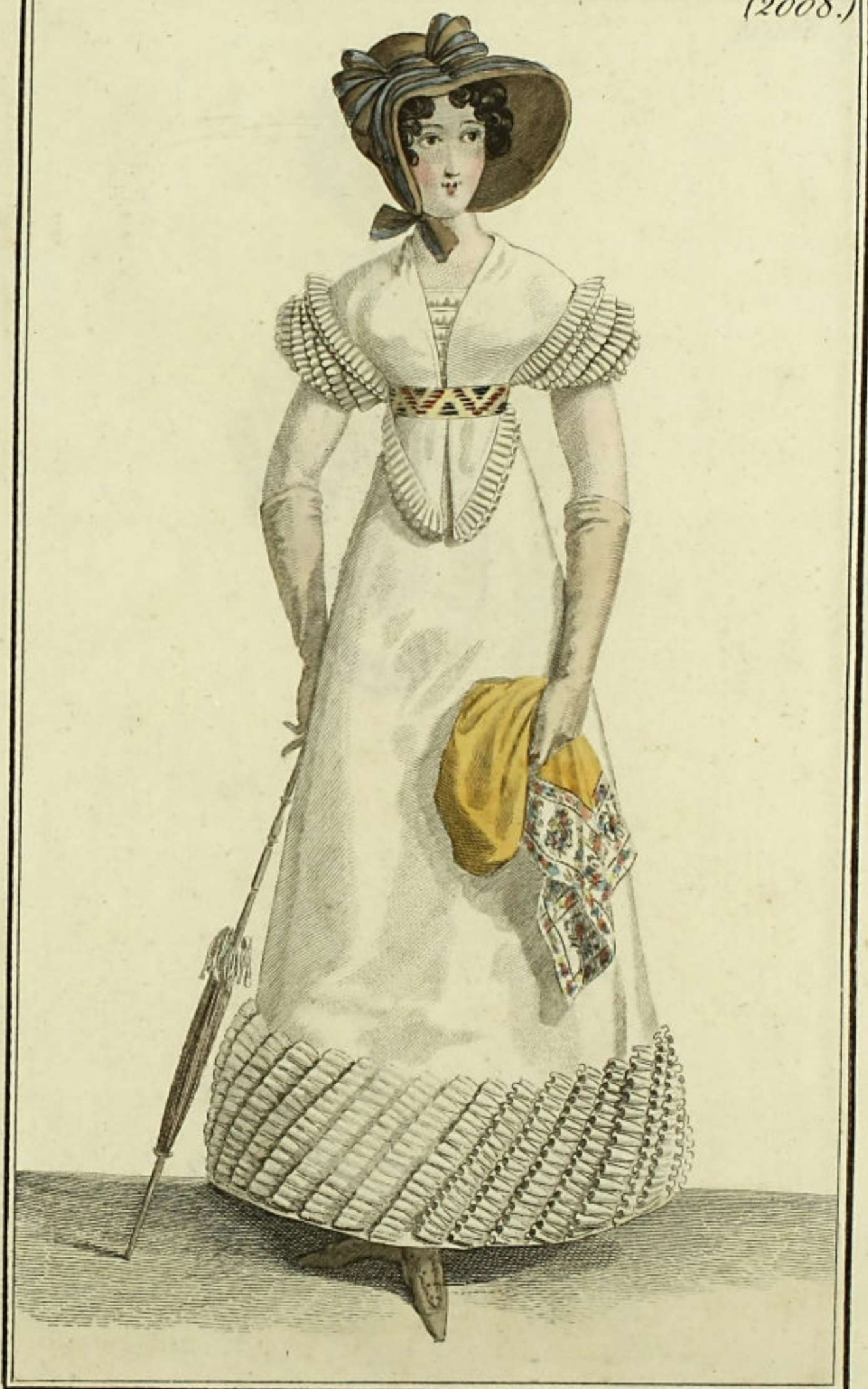
Capote de batiste écarlée. Robe de percale garnie de mousseline. Fichu de mousseline avec garniture pareille.