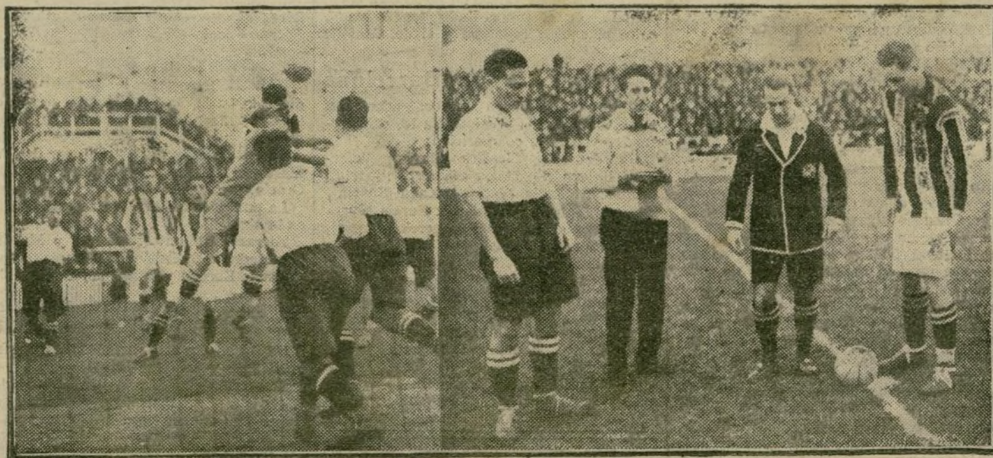
Las intervenciones de Martínez fueron frecuentes y enérgicas.—Los preliminares de rigor.