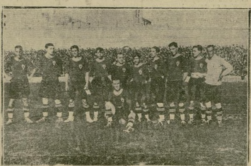
El equipo del Real Murcia F. C., antes de empezar el partido de ayer