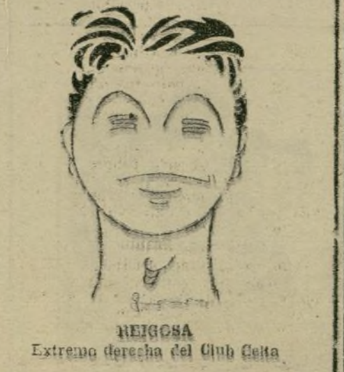
NEIGOSA Extremo derecha del Club Celta

En los demás países, el 90 % de los Ford van equipados con el carburador Smith. No hay razón para que en España no se dé este mismo porcentaje.