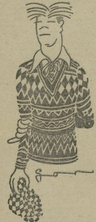
ZAMORA, el internacionalista guardameta del Español

Durante el primer tiempo, se ha visto un