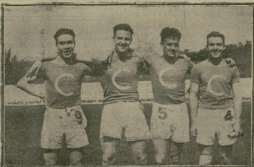
Equipo de la Escuela de Ingenieros de Caminos, vencedor en la carrera de relevos correspondiente al campeonato universitario de atletismo