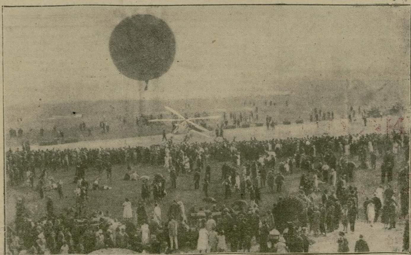
LAS PRUEBAS DEL AUTOGIRO LACIERVA EN ALEMANIA.—Momento de despegar el autógro Lacierva, durante las pruebas públicas de este aparato, recientemente verificadas en los alrededores de Berlín.

Su automóvil arrancará fácilmente en las mañanas frías si usted utiliza MIXTROL. El MIXTROL asegura la fluidez de su combustible. El MIXTROL prolongará la duración de su motor. Con el MIXTROL no se le engrasarán las bujías. El MIXTROL dará mayor potencia, más velocidad, aceleración a su coche. El MIXTROL es el lubricante más perfecto que se conocía. Se mezcla a la gasolina. Utilice usted en su combustible y se sorprenderá por sus resultados maravillosos.