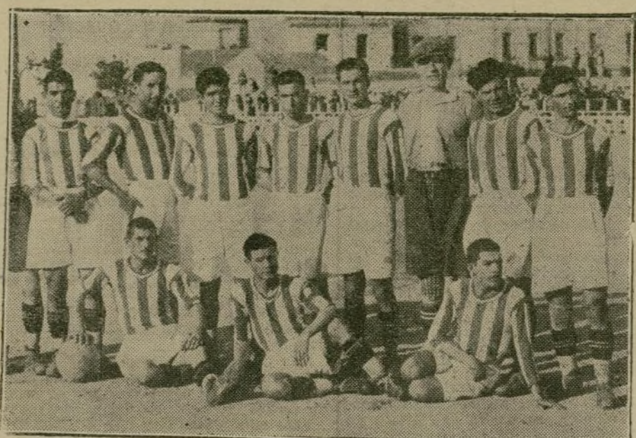
El equipo del Real Betis Balompié, que, a pesar del lógico desentrenamiento de principios de temporada, ha producido excelente impresión ante el público chambeiro.