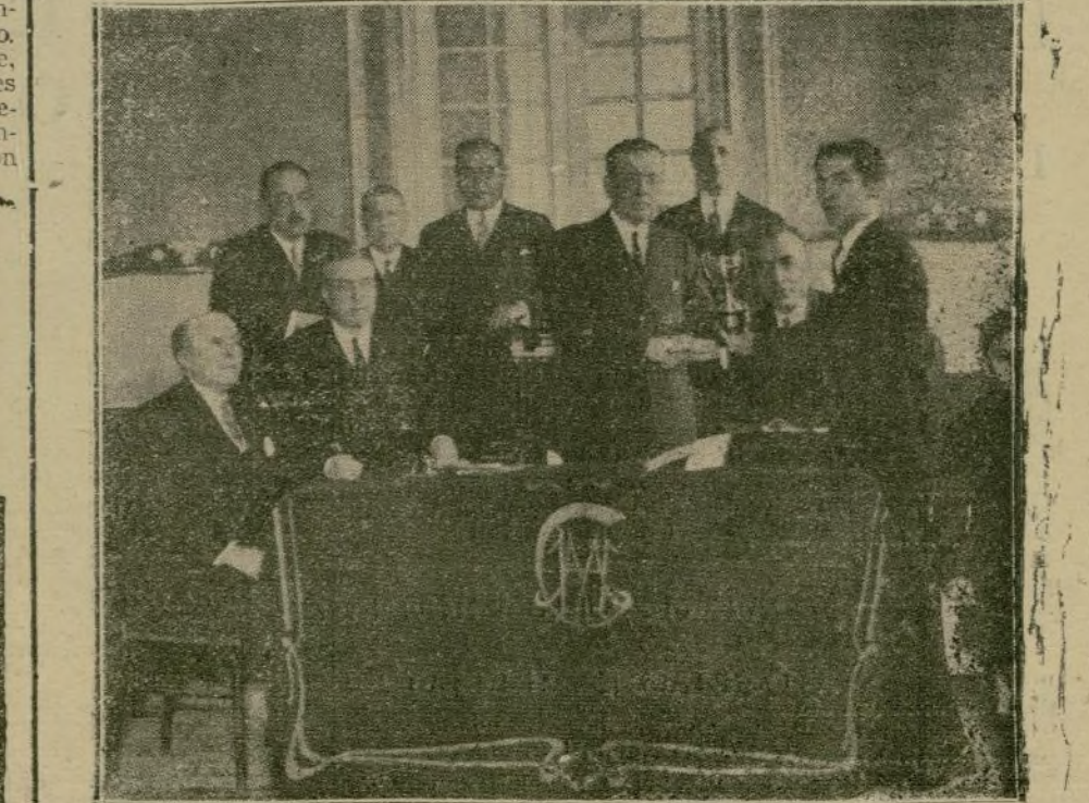
Reparto de premios a los vencedores en el campeonato de billar del Centro de Hijos de Madrid.

Fábrica de mesas de billar y bolas de marfil. Accesorios. Ebanistería. Tapicería. Decoración. MORATILLO, 11 y 13.—MADRID