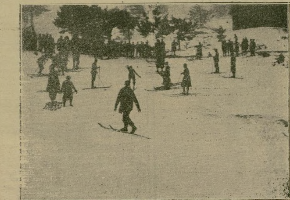
La iniciación de la temporada de invierno en Alemania.