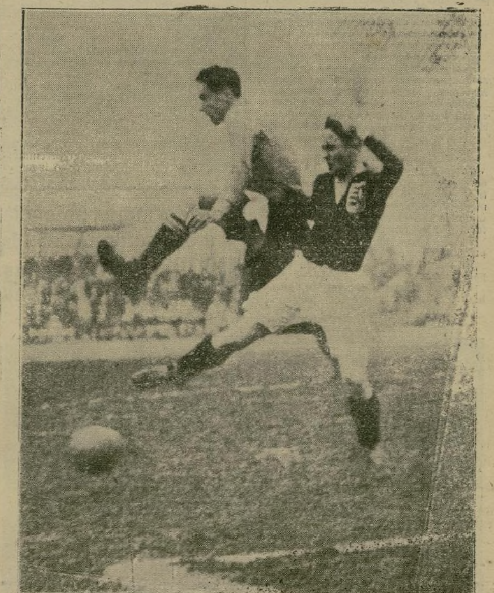
Una entrada de Valderrama durante el partido del miércoles en Chamartín, en el que la selección Centro alcanzó una brillante victoria sobre el equipo de Hungría.