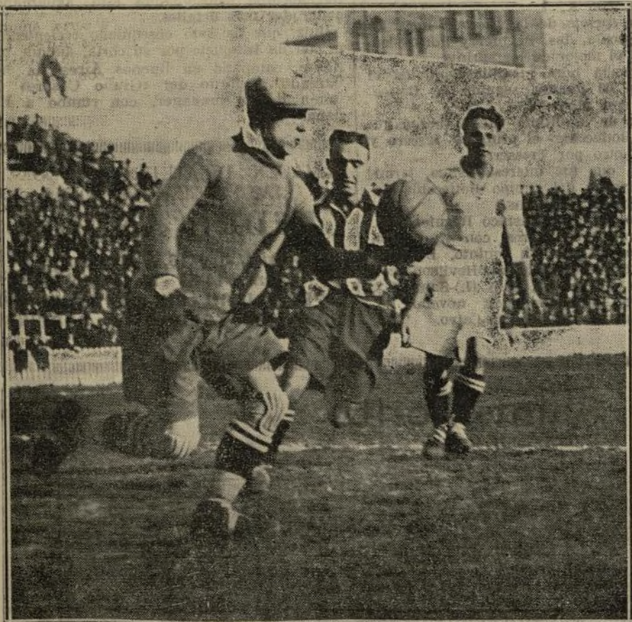
Triana fué en todo momento el más codicioso de los delanteros rojiblanco. Varias veces hubo de esquivar la defensa de Quesada, obligando a entrar en acción a Martínez.