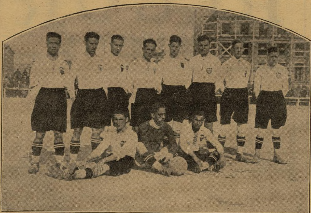
UNA. BRILLANTE EPOCA DEL VALENCIA