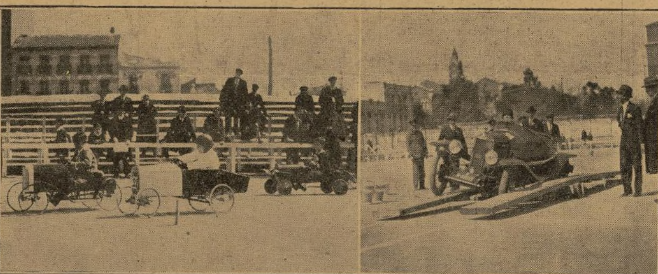
Las carreras de niños y la ghyrkana automovilista para damas, verificadas el domingo en el campo del Racing en un festival a beneficio de los damnificados de Cuba, constituyeron un interesantísimo y agradable espectáculo. He aquí dos episodios de estas simpáticas pruebas