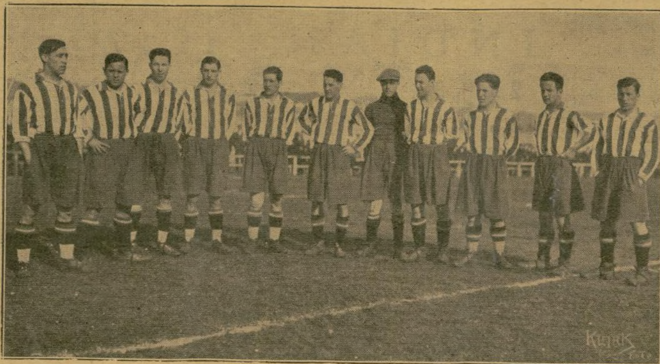
El actual Campeón de Asturias