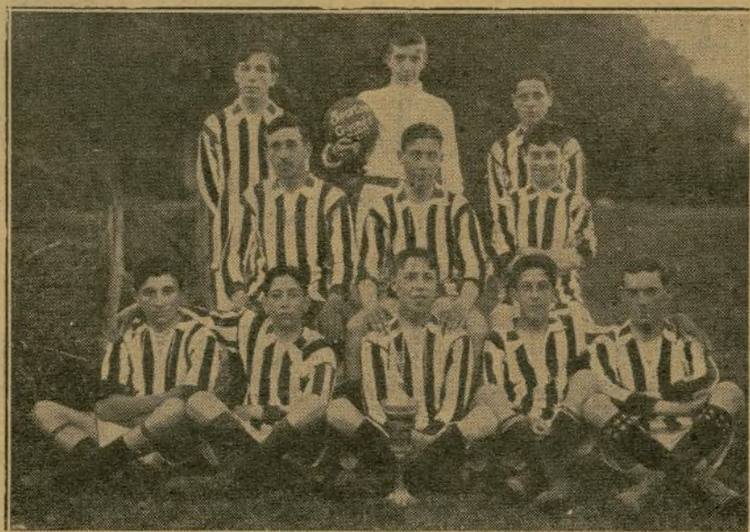
El primer equipo que tuvo el Real Sporting, con la copa del Rey ganada en 1911

Abril 13.—Segundo partido, en el Molinón, lo gana 2-0. Se celebra el desempate en el Stadium Metropolitano (Madrid)