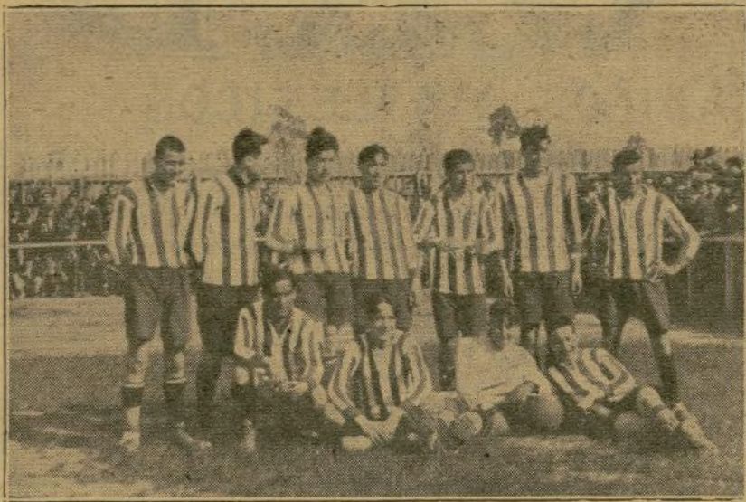
Equipo que intervino por primera vez en el Campeonato de España en 1917

el día 16 de abril. Este partido se dió por ganado al Barcelona por 3-1, a causa de haberse retirado el Sporting dada la deficiente actuación del árbitro señor Colina.