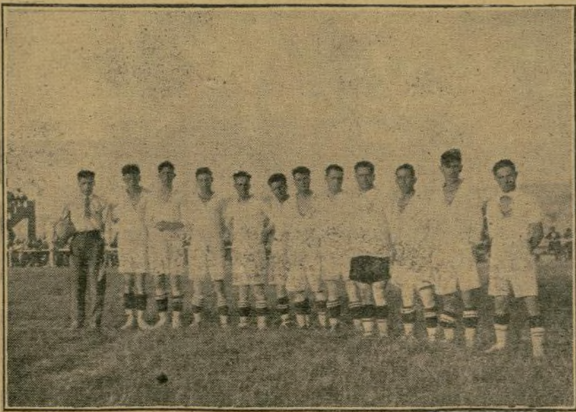
Equipo de la Unión de Carthago que en brillantísima actuación ha conseguido alcanzar el título de campeón regional, grupo B y que en la próxima temporada jugará por acuerdo de la Federación murciana, en el grupo A

En Alemania, el Gobierno ha dedicado ya 150.000 marcos para la preparación olímpica y ha previsto la concesión de 300.000 para los gastos que origine la asistencia a la Olimpiada. Hungría ha suministrado diferentes sumas al Comité Olímpico y separadamente a las Federaciones deportivas más cantidades para su preparación. Ha alquilado ya una casa en las cercanías de Amsterdam para albergue de sus atletas. Dinamarca no ha votado todavía ninguna cantidad por la situación económica que atraviesa, pero, desde luego, conseguirá 50.000 coronas que son las que ha pedido al Gobierno. Francia ya sabemos su situación, que parece se aclara. Inglaterra, dedica ya toda la atención a los deportes en que participará. Quedan fuera Suiza, que con menos representantes y menos gastos, también organiza la participación, y Holanda, que hace toda clase de esfuerzos aparte de llevar a cabo la obra tan dificultosa en estos momentos de poner en pie las Olimpiadas de 1928. Estados Unidos siempre están preparados, y su "tren" de atletas vendrá con toda la esplendor que acostumbra a Europa, y Finlandia tiene siempre a punto el arsenal de atletas que son el pasmo y envidia de los americanos.