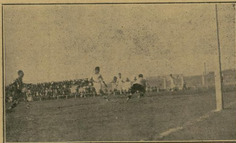
Una jugada del partido final del campeonato entre el River Thader-Unión Deportiva Carthago

Por sus méritos espléndidamente manifestados durante dos temporadas ¡al fin! ha podido entrar por la puerta grande en el grupo A de 1.ª categoría.