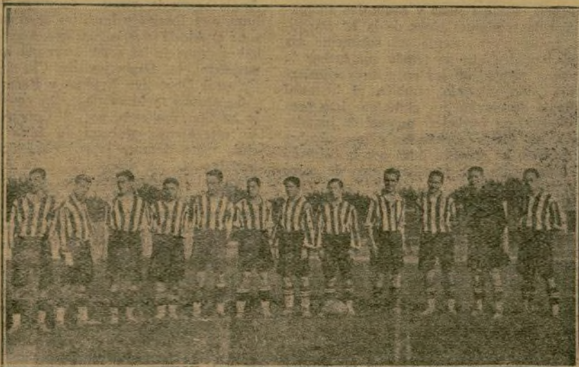
El equipo del Club murciano River-Thader, recientemente ascendido al grupo A

El Real Murcia F. C. cuenta para la próxima temporada con los siguientes jugadores: