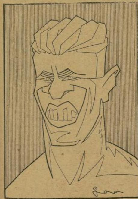
GENE TUNNEY campeón mundial de pesos pesados, que pondrá en juego su título en el match que celebrará con Dempsey.

La inscripción pasa de un centenar. El pesaje y reconocimiento médico se celebrarán el 12 del actual, a las ocho de la