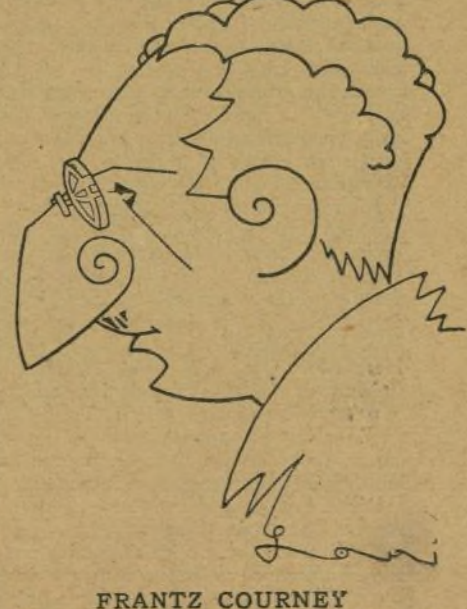
FRANTZ COURNEY Piloto inglés que realizó las pruebas del autogiro de La Cierva y se propuso atravesar el Atlántico