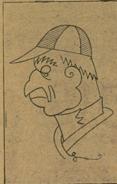
Lucien Buysse, el gran corredor francés que ha participado en esta prueba