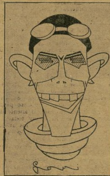
Cepeda, el routier vizcaíno, uno de los mejores nacionales de la Vuelta al país vasco

ganadas por Leducq, que mostró una gran forma, y la tercera por Fontán, que, recuperando muchos puestos, alcanzó el primer lugar de la clasificación general hasta el momento, con bastante ventaja sobre los restantes.