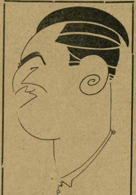
Casanovas, que arbitró el interesante "match" Cola-Rayó en Barcelona