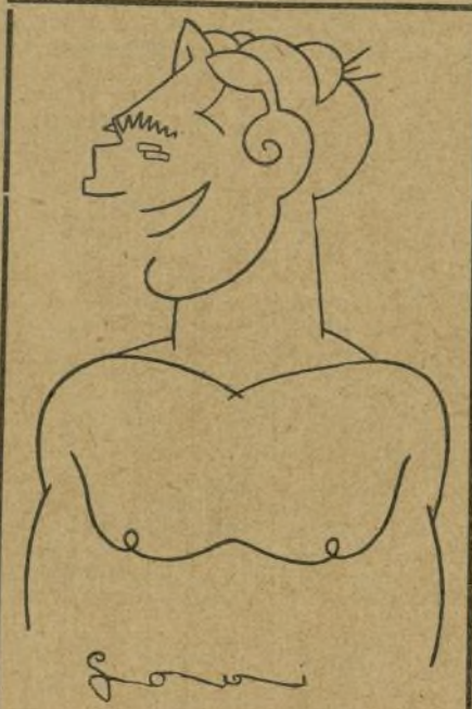
Cola, a quien ha ganado Rayo el campeonato de peso ligero

Resultados de la reunión de clausura celebrada en Colombes (Francia). 300 m.—1.º, MANNAERT, 35 s. 3/5; 2.º, Sylvestre; 3.º, Krottoff. 500 m.—1.º, FEGER, 1 m. 6 s. 1/5; 2.º, Jousse; 3.º, Vancon. 2.000 m.—1.º, LADAUNIEGE, 5 m. 28 s.