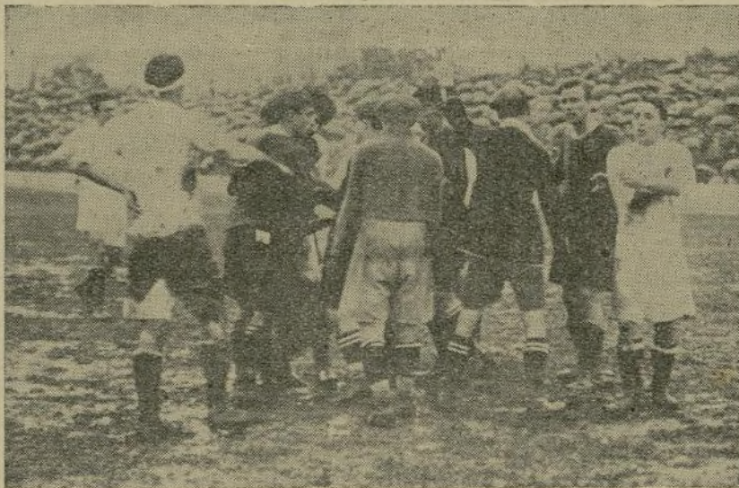
Hubo momento en que se temió la nota poco simpática del altercado en el terreno de juego; pero Comorera, enérgico, impone la sanción, mientras por la actitud de los jugadores madridistas se advierte la tranquilidad.

un dominio no interrumpido y escalonados, siguiendo casi un orden cronométrico y alternando con ellos intentos merecedores de nuevos goals y corners diversos, entonces la victoria es justa, normal reflejo de una superioridad manifiesta, patentizada en todas las fases del match.