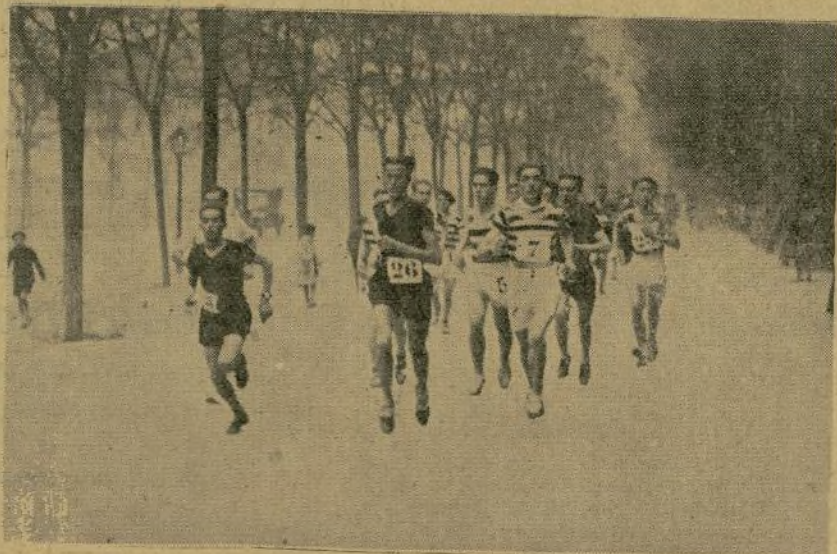
DEL TROFEO TEJA.—Una fase de la interesante carrera a través del campo, organizada ayer por el Racing Club, por las intermediaciones de Parisiana, y en cuya fotografía aparecen los más destacados participantes.