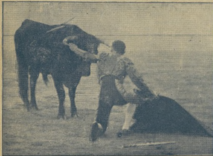
MARCIAL LALANDA, el torero de las cien corridas en esta temporada, coge el pitón de su enemigo, en el coso valenciano, para demostrar a los aficionados que el cornúpeto no valía una peseta. / Esto lo hace MARCIAL, mientras los demás corren de un lado para otro buscando una sonrisa en el tendido, con que aminorar su fracaso en el ruedo.