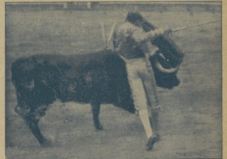
ARMILLITA CHICO, el sabio torero mejicano, demostrando para qué le sirve la mano izquierda, una parte del cuerpo humano de la que la mayoría de los toreros no se han dado cuenta que existe. / ARMILLITA EL SABIO justificará esta temporada su cartel de torero grande en cuanto le embista un toro por derecho, porque para eso lleva dentro dos foscillos.

Los Caireles GRAN COLMADO Plaza de Cebada