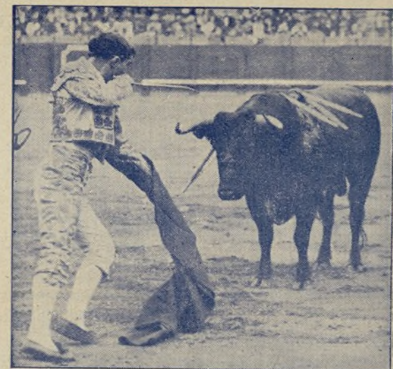
GORDILLO , el bravo sevillano, perfilándose para meter hasta la gamuza a un buen mozo de Santa Coloma en Sevilla.

Al Torero Desconocido le han regalado un «auto». Hace un par de años tuvo una cuestión con un choffer, y más tarde los «chuferos» le nombraron «socio» protector. ¡Como ven ustedes, el Desconocido es un diestro de gasolina!