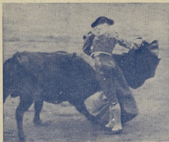
RICARDO GONZÁLEZ , el torerísimo diestro madrileño, demostrándolo en este lance repleto de arte y emoción. ¡Si todos los artistas torcasen así, otro gallo cantaría a nuestra fiesta nacional en los momentos actuales!