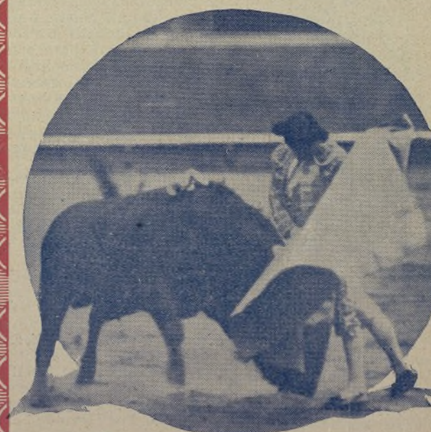
VICENTE BARRERA , el joven matador valenciano, torcando con el capote con arte, valor y temple. Este torerísimo diestro triunfó el pasado domingo en Barcelona.

tal fecha, según los proyectos del empresario. Nosotros recomendamos a los numerosos lectores que este semanario tiene en Barcelona se abstuvieran de asistir a la corrida de toros, y así lo hicieron. La entrada fué malísima, pues por dicha causa y por no tener cartel alguno los «Paralelos» en Barcelona, los toreros empresarios no sacaron ni para pagar