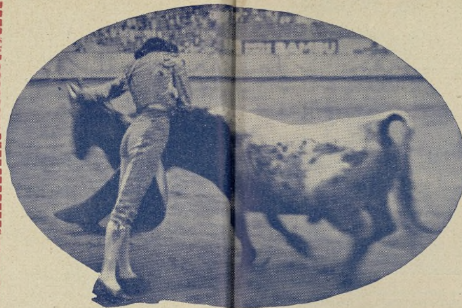
ARMILLITA CHICO , el sabio torero mcano, el triunfador del pasado domingo en Málaga, lanceando de capa con sabor de torero que llega donde quiere y triunfa cuando le da la reverendísima gana. Ahora, que el día que torce en Madrid ya verán udes que escandalera.

Ahora, que el «tintineo» de unas monedas ha servido para que picaran algunos corresponsales, tapando el fracaso. ¡Véase la clase, señores!