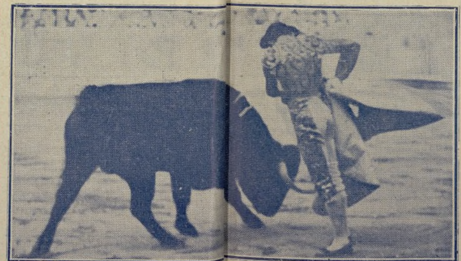
MARCIAL LALANDA , el amo de la lidia taurina en España y casi del extranjero, rematando con media verónica en Barcelona, que levantó al público de sus asientos.

Para demostrar que muchos fracasos han sido convertidos en la prensa en éxitos, reproducimos en este número de TORERIAS, a la salida de un molinete. ¡Y el esjuicio y revistas de los diarios de pado aparece en los medios con la provincia. Demostramos también muleta rodeada al cuerpo, como los con tal procedimiento, que el frío y paletos llevan la faja, y el toro se ha mal temporal de estos días últimos. ¡Catastrófico y definitivo! chos corresponsales. ¡Y temíamos a llEse es el pase de la «pescadilla» a las nieves del Guadarrama! tres kilómetros del toro!