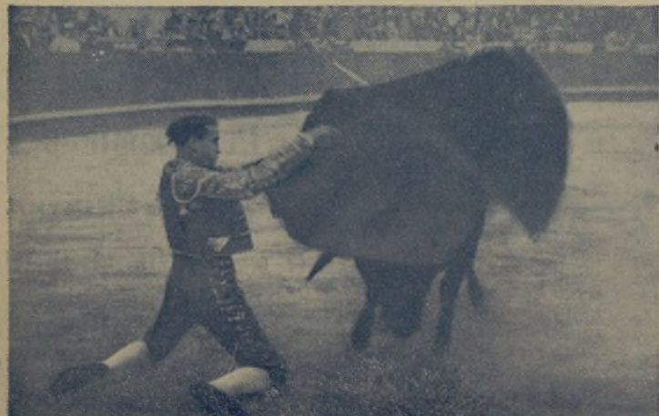
El emocionante TORON que continúa encarcelando la fila. El diestro de Tafalla es un torero religioso, pero de los que se arrodillan antes de pasar la procesión. ¡San SATURIO, rey del valor! ¡Descubrirse!

Por ello, el ex-redactor de «La Correspondencia» de Valencia, ante la natural sorpresa de Thous, no cesaba de gritar hace días en la calle de Las Barcas: ¡Caballos! ¡Caballos! ¡Y saltó y vino un «Clavileño»!