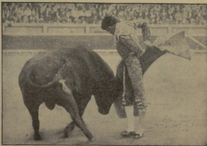
ARMILLITA CHICO EL SABIO, que el día 25 del actual se presentará con Marcial Lalanda en la Plaza de Toros de Sevilla. ¡El arte finísimo de FERMIN, como puede verse, entusiasmará a los aficionados sevillanos!

¡Pero qué bien que se está en Vista Alegre!