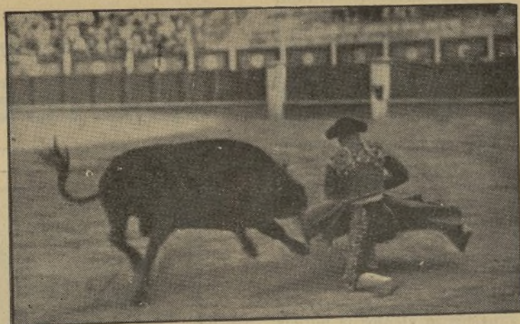
ENRIQUE TORRES, que hoy se presenta en Madrid, después del enorme éxito del año último, acompañado de dos «peones de mano» de la tauromaquia. / ¡Como al valenciano le salga hoy un toro embistiendo a modo, se van ustedes a chupar, con permiso de Quiroga, los dedos de gusto!