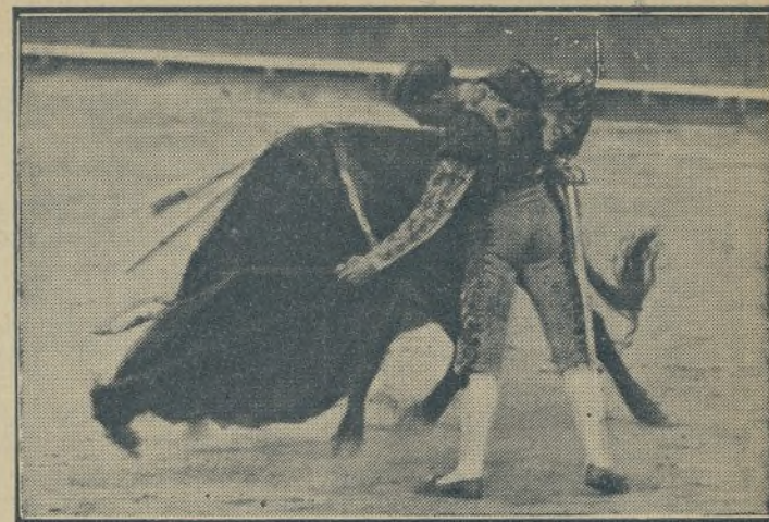
MARCIAL LALANDA no para, no manda, no sabe torear al natural, como lo pueden ustedes apreciar en este momento del genial maestro. / ¡Ah! Se nos olvidaba decirles que es el único torero que llena la plaza de Madrid y hace que se vendan las andanadas a treinta pesetas.

VINOS FINOS Y CERVEZA FRIA Núñez de Arce, 5. Tel. 19.527