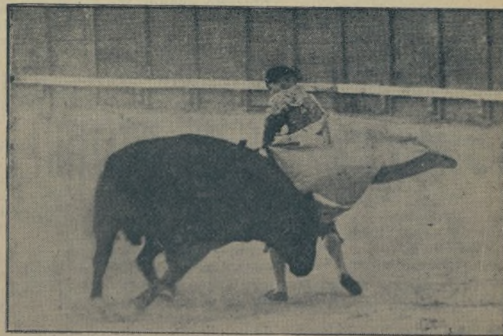
No será FORTUNA un estilista del toreo, ni sus lances irán repletos de esa filigrana modernista que tanto ha perjudicado al arte, pero, en cambio, se lia los toros al cuerpo como si los pitones fuesen de merengue. / ¡Este es DIEGO, el mejor matador de toros que ha nacido en el arte de Cúchares!

Ayer visitamos a Luisito en el domicilio del señor A. Mo-