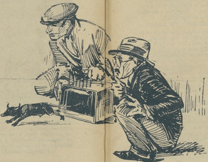
Emocionante escena que se ha de repetir con mucha frecuencia, al reconocerse por los señores veterinarios las terribles fieras que envían los ganaderos a las plazas de toros. ¡Ahí va la rata!