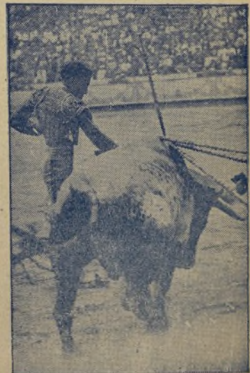
Es ARMILLITA CHICO la filigrana del arte con la muleta en la mano, la cual no tiene secretos para el joven y ya maestro mejicano. / Hoy debuta en Sevilla y apostemos un pitillo a que como torero un toro con la mano izquierda se hace el amo.