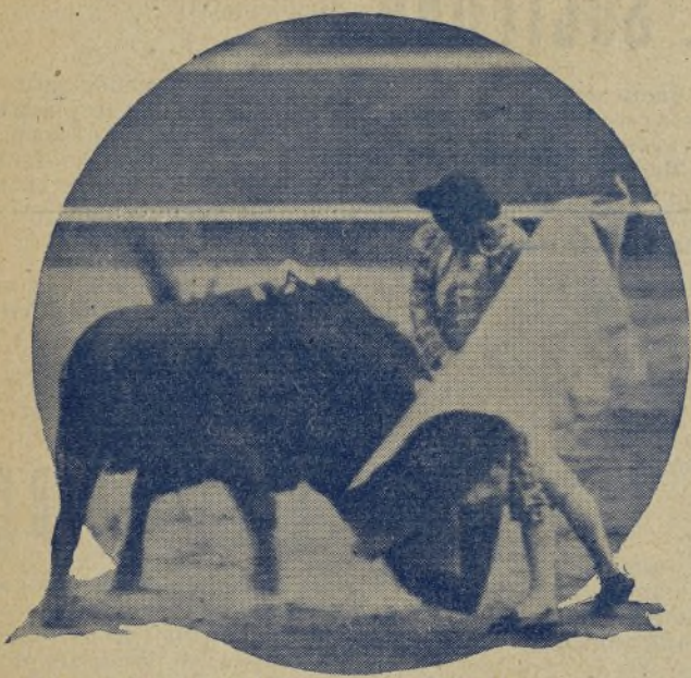
VICENTE BARRERA, el diestro valenciano, toreando con el capote con el estilo en él peculiar. / A Vicente Barrera una importuna enfermedad le ha privado de justificar sus triunfos provincianos en el ruedo madrileño. ¡Lástima que esto haya sucedido, porque el triunfo del valenciano se estaba mascando!