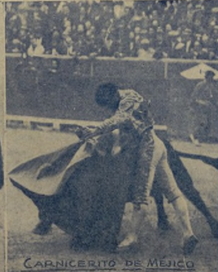
CARNICERITO DE MÉJICO