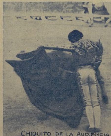
CHIKUITO DE LA AUDIENCIA