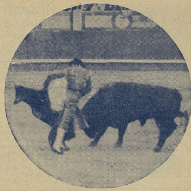
El viejo maestro MARCIAL LALANDA rematando con media verónica una serie de lances que antes habían embriagado a los aficionados. / Marcial triunfó en Zaragoza el pasado domingo, en el preciso momento que Antonio Combro, Cuatro Chaquetas y el Niño de Bieimperdida, salían a pedradas del ruedo cortesano.