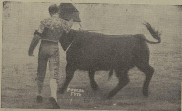
EL ESTUDIANTE, torerísimo novillero madrileño, en un momento de su arte, de ese arte que coloca a los toreros en un lugar preferente al de los demás. / No sabemos como este ESTUDIANTE, que se lo sabe todo, no ha torcado todavía en alguna plaza del extrarradio. ¿Será porque acaba el vapor? ¡Cál vez!