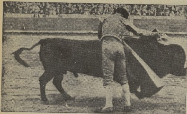
EL LEON DE NAVARRA, el bravo entre los bravos SATURIO TORON, el que en la capital cordobesa puso a los califas en pie, torcando temerariamente con la muleta. / SATURIO TORON se doctora en Pamplona, de manos de Marcial, y es de esperar que de ahí en adelante se haga el amo de la torería, por su valor, su arte y su dominio con la muleta.