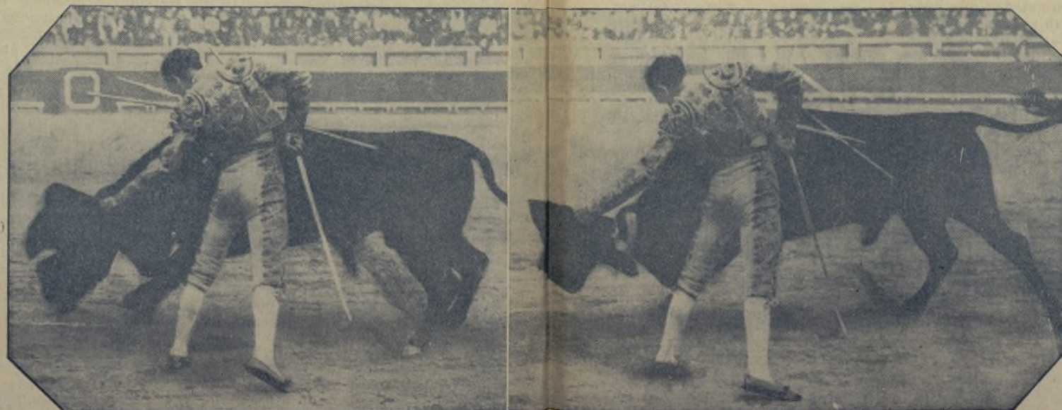
MARCIAL LALANDA el joven maestro, torcando al natural con el arte, el valor y el dominio que sólo es patrimonio suyo. / Hoy torcea en Madrid, en plan de hombre serio con la Empresa, y tengan ustedes la seguridad de que se justificará sobre los demás toreros y sobre los empresarios de España entera.

¡No deje de acudir el próximo jueves a Toledo!