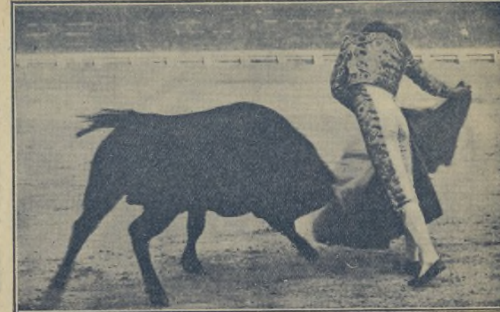
EL CAGANCHO MEJICANO, el torerísimo LUCIANO CONTRERAS, en un lance de capa que le acredita de artista, de los que con sólo una actuación se colocan a la cabeza de la grey novilleril. / El domingo formó otra escandalera en Tetuán, y hoy y el jueves tendrá una continuación; y en seguida a Sevilla, la cuna de los toreros, a demostrar el por qué los aficionados madrileños le llaman EL CAGANCHO MEJICANO.

¡Cagancho! ¡Gitanillo! Como «quies» «contiparar», un charco con una fuente, sale el Sol, se seca el charco y la fuente «pirmanece».