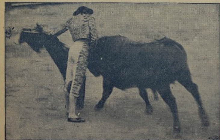
ARMILLITA CHICO «EL SABIO» , tirando su línea con el capotillo. El jueves toró en Toledo, y, como en todas las corridas, los peores toros le tocaron a él, y triunfó. ¡Por algo es EL SABIO, el que más puede y el que más domina a los malos!

cuelo y Bienvenida, la corrida fué objeto de suspensión por hechos del dominio público. Chicuelo y Bienvenida, por no tener categoría para ello, por congraciarse con la empresa, por esperar el premio de una galantería o por otras razones que desconocemos, cobraron solo los gastos, importantes según ellos la cantidad de 1750 pesetas por barba. ¡Y esto de la barba es un decir porque Bienvenida aún no ha dado a ganar dinero a los barberos!