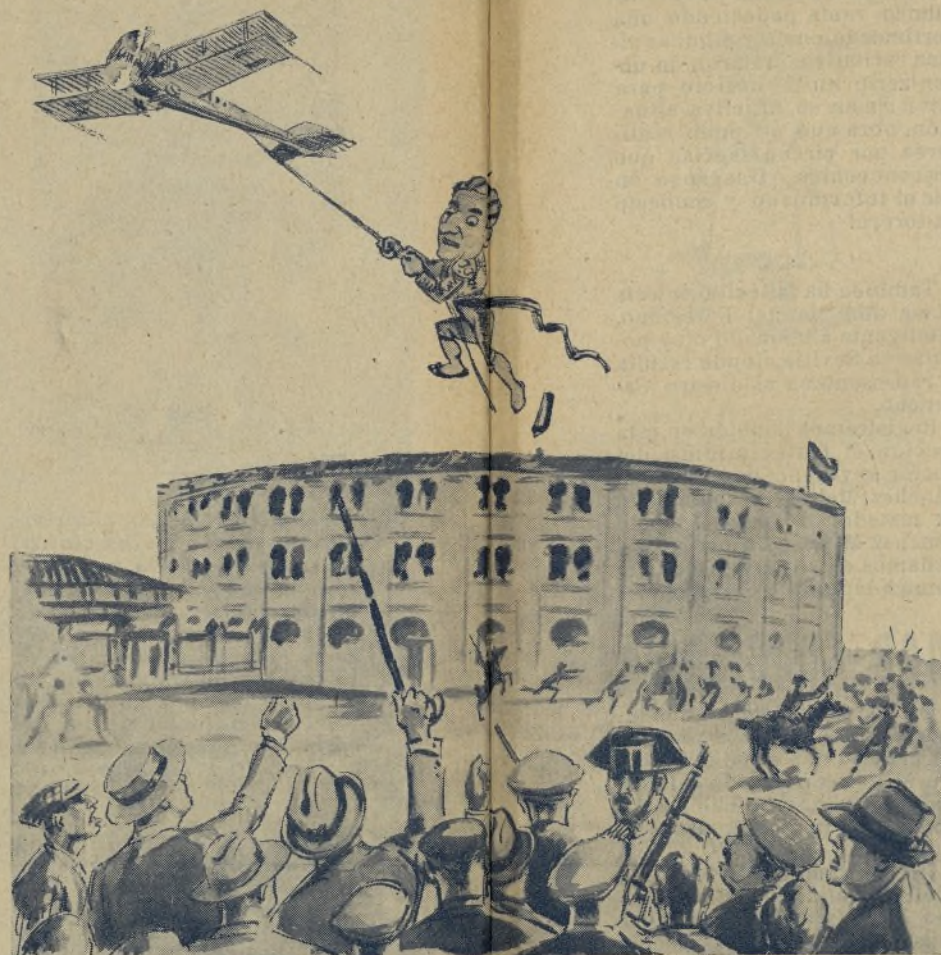
Salida de la Plaza de Toros de Madrid que tendrán que adoptar los fenómenos de la torería, en vista de las razones contundentes con que son obsequiados a la salida por los aficionados, en pago a su desfachatez y desvergüenza derrochadas en los ruedos. (Apunte ideado antes de las famosas declaraciones en Crónica del obrero del toreo Fuentes Béarano, en las que después de poner como un pinga a sus compañeros, decía que sentía un miedo feroz a la salida de las plazas.