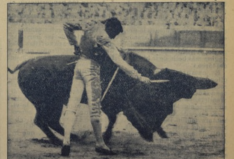
ARMILLITA CHICO , el gran artífice del toreo, que este año lleva realizando una estupenda temporada, y que «borda» el pase natural, como se puede apreciar en esta foto. / ARMILLITA CHICO es una figura imprescindible en la próxima temporada de México, aunque el menudo Pandilla crea lo contrario. ¡El hombre del busto verde tendrá que «doblar» ante FERMIN, uno de los que podrán salvarle del negocio! ¡Así lo entiende la afición mexicana, que espera a FERMIN con los brazos abiertos!