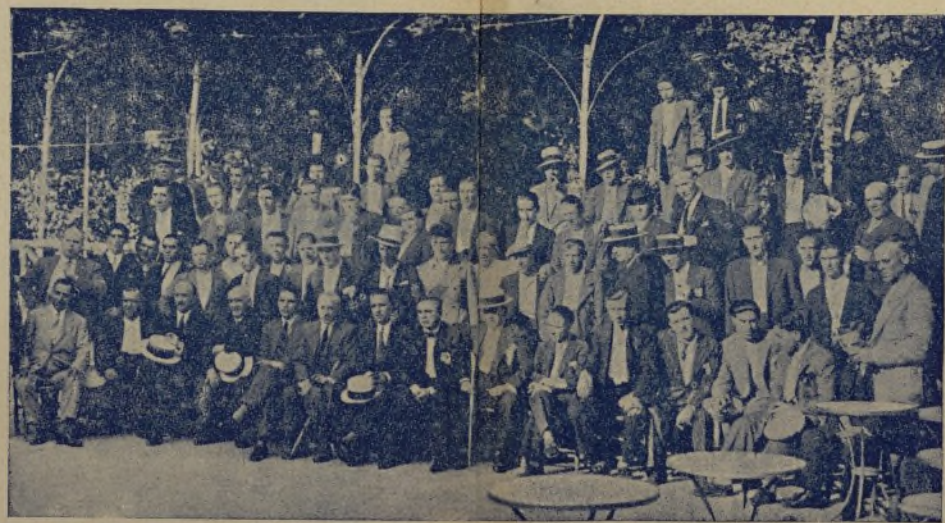
Grupo de concurrentes al banquete que el pasado domingo se celebró en la popular Casa Juan, para testificar a Pita y demás camaradas del Matadero, sus gestiones para el ingreso de varios camorristas que se encontraban despedidos desde hace varios años. Fue una fiesta simpatísima, donde se refirió una vez más el poderío de estos hombres unidos por un sólo ideal.—Fot. Rodero.

Los mejores grabados, Truts Gráfico Principe de Vergara 42 y 44. Tel. 57964