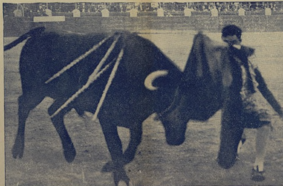
VICENTE BARRERA , el genial artista con la muleta, que se está hinchando de toros y de conseguir triunfos acconantes. / Comentamos los triunfos de BARRERA por lo que sufrirán los que ya creían que el valenciano se había terminado, con la herencia de unos millones.