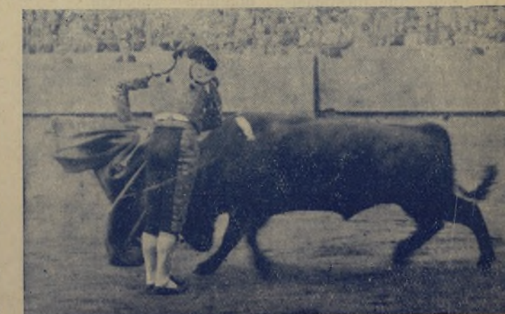
El gran matador JAIME NOAIN rematando con media verónica una serie de lances de esos que no se olvidan tan fácilmente, y de los que hacen emocionarse a los aficionados

Marquez, un torero bien enterado, que temple y manda