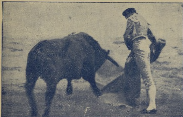
REVERTITO , el gran matador de toros y excelentísimo torero sevillano, en un momento de sabor clásico con el capote. / El maries le cogió un toro en San Martín de Valdeiglesias de gravedad. ¡Lástima que desde poco tiempo a esta parte persiga la desgracia a quien como REVERTITO puede ser figura.