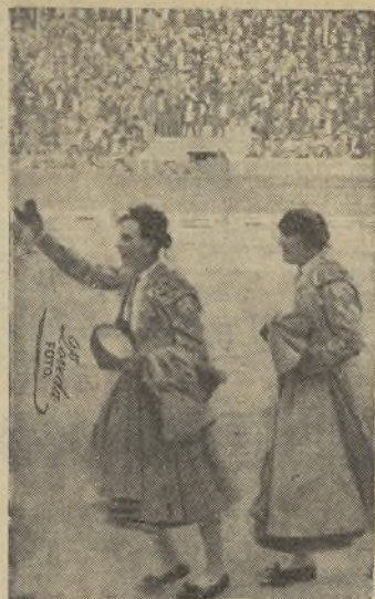
LUCIANO CONTRERAS, el excelso torero mejicano, que al salir de una grave cornada no se le ha ocurrido nada más que arrojarse en Murcia y cortar las orejas de sus enemigos. / ¡Así da gusto apoderar toreros, señor Merchán!