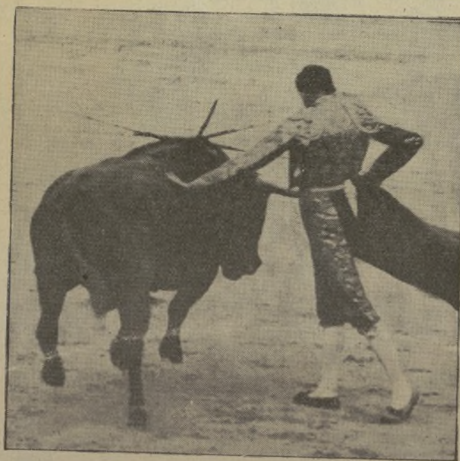
Este «pobre» MARCIAL, que no se arrima en ninguna parte, y no corta orejas ni recibe ovaciones, es el que va a la cabeza de todos los matadores de toros, en corridas de calidad y cantidad. / Esta semana no tora nada más que todos los días. ¡Y eso en octubre y con un pie en el barco para ir a Méjico!

¿Serán capaces ahora de enviar una carta a El Eco Taurino , firmada por testigos presenciales, diciendo que todo