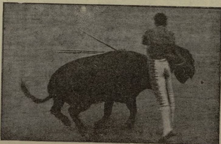
Armillita Chico, derecho como un poste, jugando admirablemente los brazos. Así toreó este artista. por eso... ¡porque ha nacido torero!