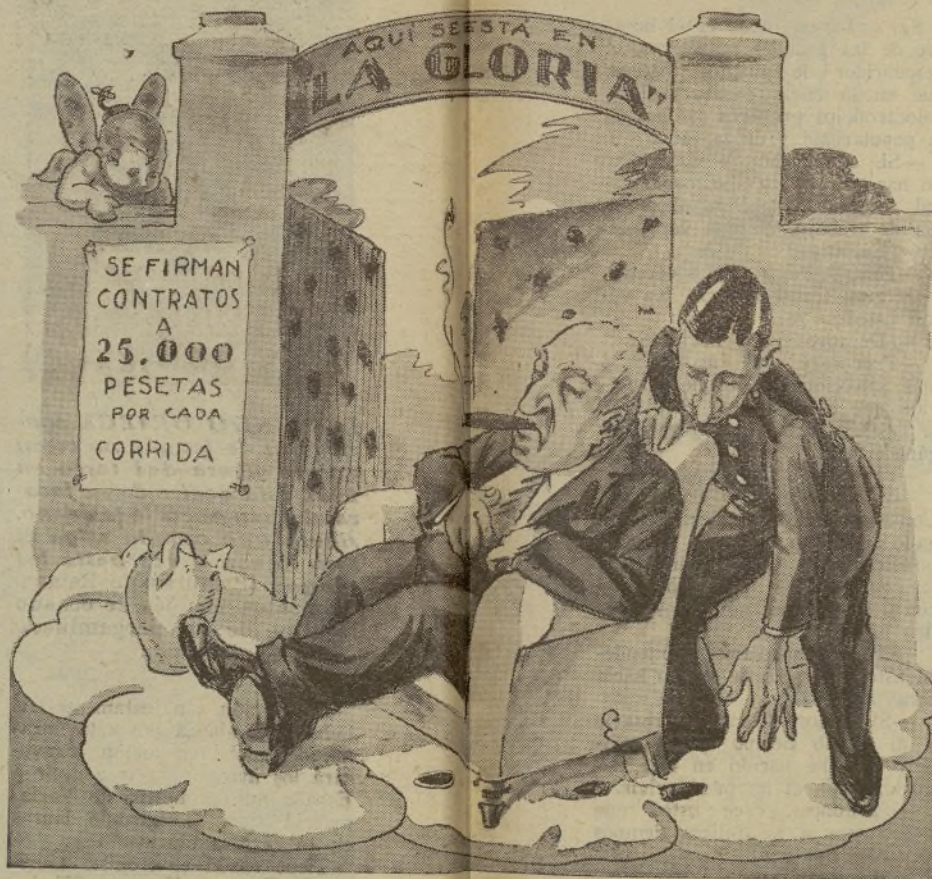
No crean que se trata de la entrada al antiguo Huerto del Francés. Es la ¡gloriosa!, donde el Papá oscuro de la lágrima pone el pie a los empresarios, mientras Don Cosmético, el fiel de los, valgaraba las «colas».