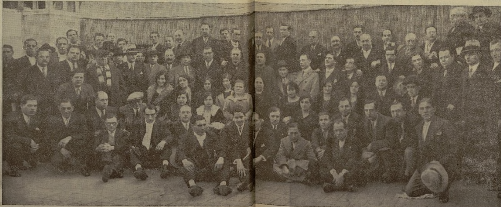
Representaciones de las Entidades Taurinas de Cataluña, profesionales aficionados de ambos sexos, que asistieron al Banquete de conmemoración del IX Aniversario de la fundación de nuestro colegio y Plata, de Barcelona, al que «clitamos» «justamente».