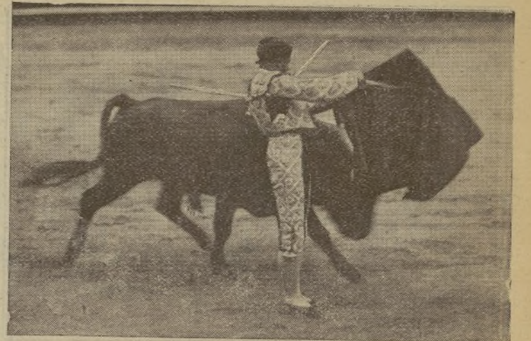
Don Valor Freg en una de sus últimas actuaciones, en México, donde demostró su gusto y su exquisitez toreando. Tomeñ nota de este valiente, que, sin abandonar su precioso estilo de matar, tora tan bien como lo haga el más perfeccionado estilista. ¡Por algo la empresa madrileña no ha vacilado en contratarle! ¡Se lo merece por su historia taurina!