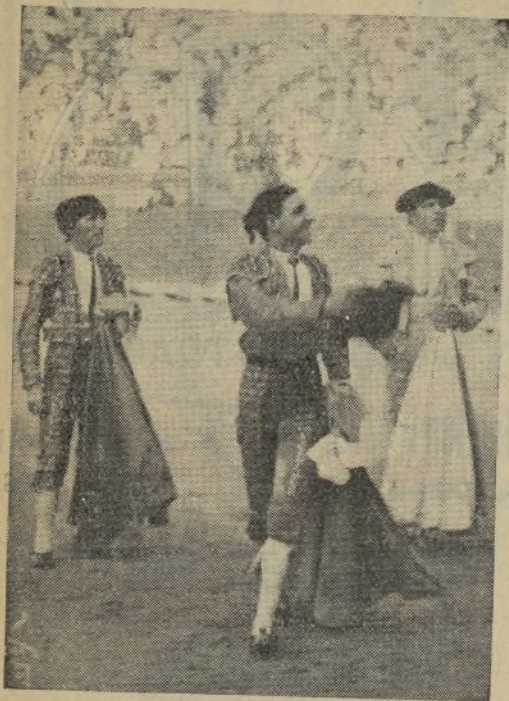
NIÑO DE VALENCIA , el excelente novillero, recibiendo una de las innumerables ovaciones con que fué premiado el arte y el valor de esta figura del torero en la brillante temporada que realizó el año pasado en las principales plazas.