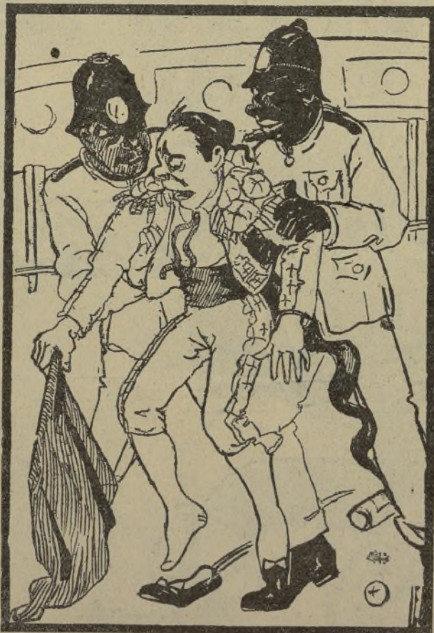
Uno de los «trunfos» del Torero Desconocido en Caracas, precisamente en la tarde que le locaron los tres avisos en un toro. Ahora nos explicamos como ha preferido quedarse fuera del abono madrileño antes que tragar los miras. Esta catástrofe «valencianista» la comenta un periódico de Caracas con la anterior caricatura, al pie de la cual, aparecen las siguientes palabras: «Bueno, pero ¿es que me van a sacar en hombros? También hay humorismo en Caracas. Y miedo. ¡Qué se lo pregunten al chato!