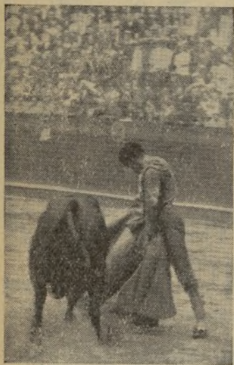
Chucho SOLORZANO, torero mejicano de los que paran, templan y mandan. Vino a España, modestamente, y en pocas corridas se empinó hasta las más altas cúspides del torero. Figurando en el abono madrileño, confirmará su alternativa y el acontecimiento será épico.