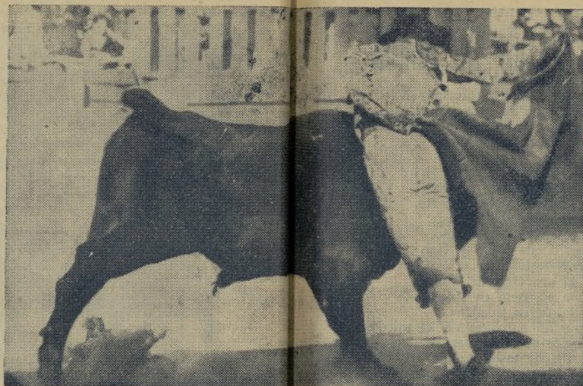
El CHIQUITO DE LA AUDIENCIA, indiscutible del capote, con el que entusiasma a los espectadores en cuantas plazas actúa.