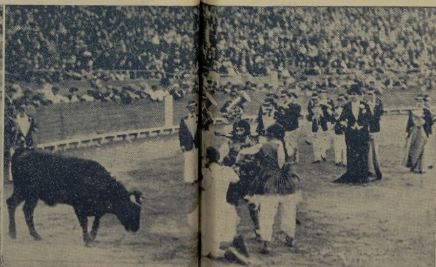
Diferentes momentos en los que el Guardia y el Bombero toreros, con los restantes componentes integran la «troupe» de LLAPISERA, hacen desternillarse de risa al público soberano.