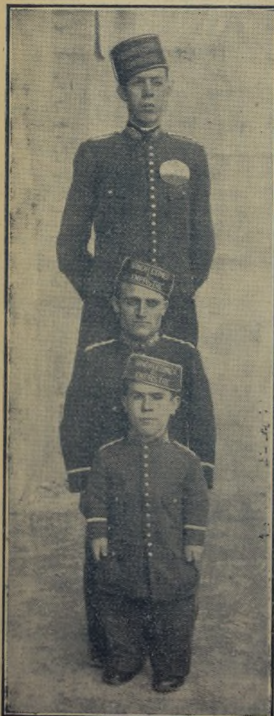
Los tres «botones» de la «troupe»