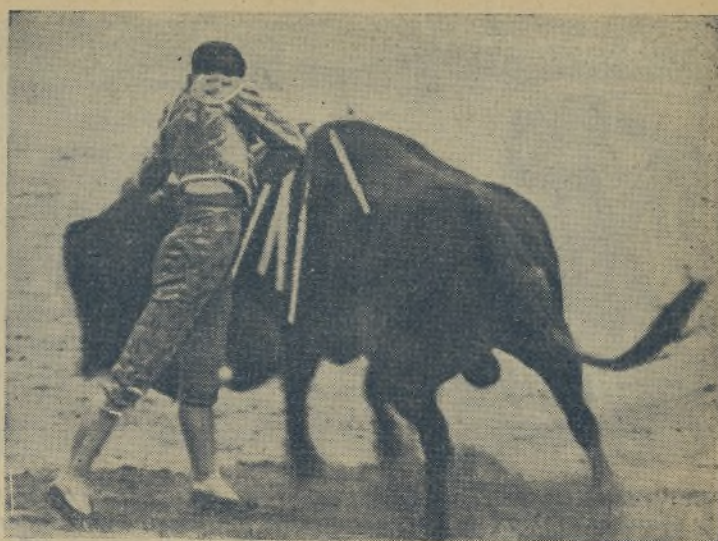
CHIKUITO DE LA AUDIENCIA, el mejor torero madrileño, demostrándolo en este soberano natural con la izquierda, que más tarde llegó con el de pecho, de manera magistral. / Sus triunfos en Sevilla, la tierra de los grandes toreros, lo acreditan todo. / Y hoy toreó en Valladolid, donde ha de lucir su fino y magestuoso arte.