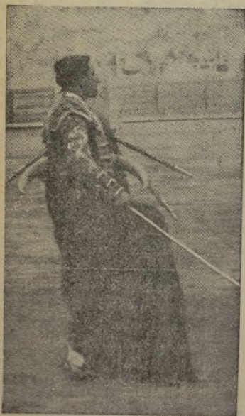
Este alarde de VICENTE BARRERA, después de una grandiosa faena de muleta, es de los que hace que los aficionados se vuelquen y empiecen a pedirle la oreja del enemigo que todavía está en pie, cosa ésta que sucedió el pasado domingo en Barcelona.

¡Señores, y qué olfato de perro pachón tiene el escribidor de la calle del Sombrerete!