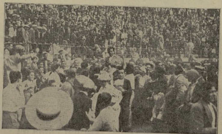
PEPITO BRAGELI, el novillero del año, saltando en hombros de sus entusiastas la tarde de su presentación en Barcelona. Cuando un torero llena las plazas y luego en hombros se lo llevan por las calles por algo será y este algo es que será el mandón de 1932.