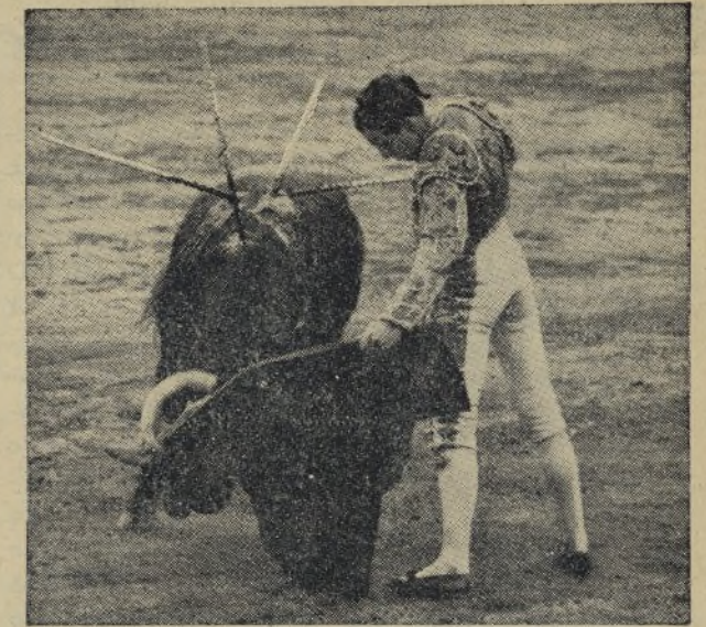
¿Se puede torrear con más naturalidad que lo está haciendo aquí «Chucho» SOLÓRZANO? ¡No señor! Por eso es por lo que los aficionados le aclaman en cuantas corridas toma parte el excelentísimo torero mejicano.