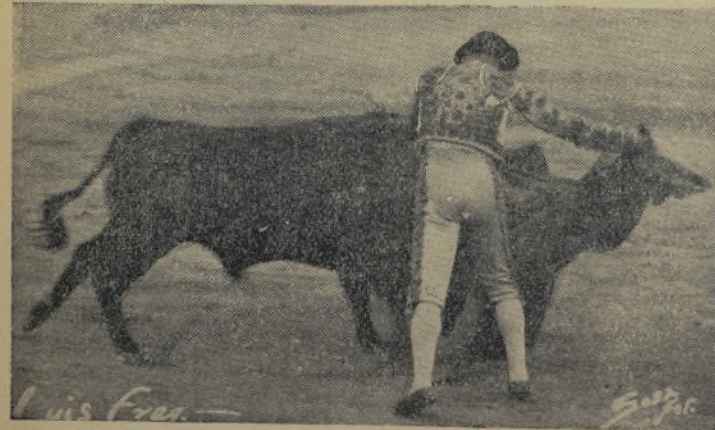
El más valeroso de los mejicanos torreando con el capote como lo pudieran hacer los estilistas. ¡Señor Salazar! ¿Pero cuándo va usted a dar a DON VALOR FREG una corrida de toros para saborear al torero macho en el ruedo?