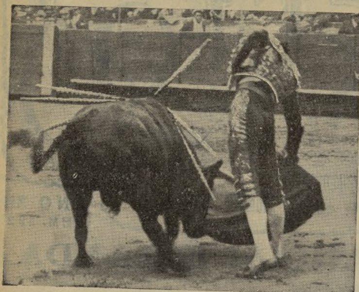
CARNICERITO DE MEJICO, el valeroso novillero que tuvo la desgracia de que un toro le cogiese en Madrid la tarde de su consagración definitiva en la torería. / El muletazo que aquí ves, lector querido, honra al bravo matador mejicano.