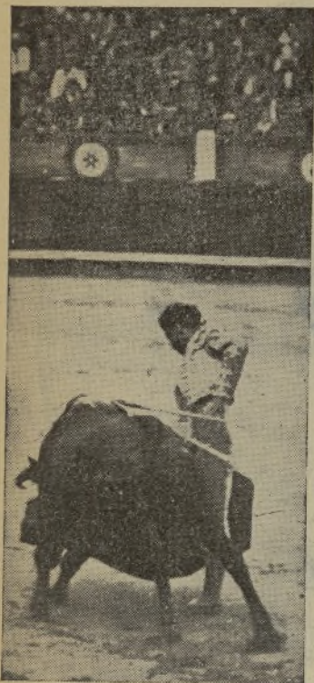
Así toreó el jueves en Madrid el ya célebre Negrillo de la Teatral a su primer toro, por lo que los aficionados se dieron perfecta cuenta de que estaban delante de un futuro matador de toros. / Este es MARAVILLA. Y así nos lo pintó «Don Justo». ¡Palabra!