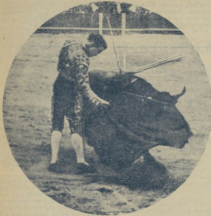
El señor DOMINGO ORTEGA, el aporador de todas las emociones en la plaza de Madrid, en un momento de su genial toreo con la mulca. / El viernes en Madrid toró un toro con el capote como hacia muchos años que no se torcaba, y ensguida las «guantás» en los tendidos. ¡Vaya un revolucionario!