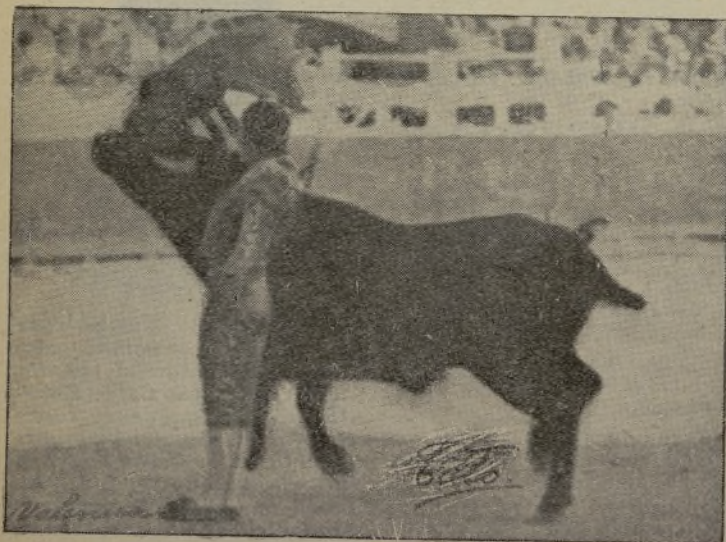
El torerísimo matador valenciano, ENRIQUE TORRES, en un soberano muletazo en el que no se sabe qué admirar más, si el salero de su ejecución o el arte y dominio que le está echando. / Se dice que el próximo día 1.º alternará en Madrid con los hermanos Bienvenida. / ¡Si es así se «masca» el baño!