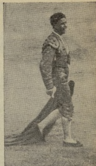
Una de las cuarenta veces que MARAVILLA ha recorrido los anillos taurinos, es la que reproducimos en este momento. ¡Lástima que este «chiquillo», hijo de la prensa profesional, apadrinado y apoderado por uno que siempre vivió de ella, tenga sus simpatías por la diarria. ¡Le digo a usted que se ve «ca» cosa en esto de los toros!