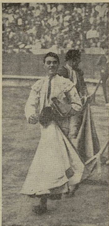
MANOLO MARINEZ, el amo del valor valenciano, triunfante de su arte recorre el ruedo barcelonés entre aclamaciones de los aficionados. Si MANOLO viene al mundo taurino en esta época de toreros de cabaret y pelo ondulado se hace el amo. ¡Palabra!