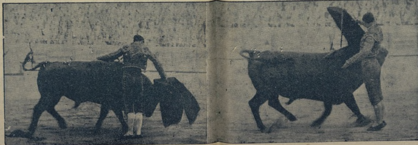
VICENTE BARRERA, el genial artista valenciano, en dos momentos de su arte dominador con la muleta que pone de relieve sus excepcionales condiciones de artista. Hoy actúa en Valencia con Marcial, Torres y Ortega y, como siempre, su triunfo será de los que se comentan una semana y hace que las empresas se apresuren a firmar corridas.