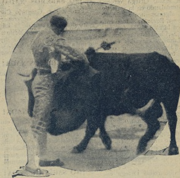
¡Llamen a PEPE ORTIZ el torero de seda; y en verdad que tienen razón para ello, pues el melicano torca con una suavidad y con un temple jamás por nadie igualado. ¡Lástima que las Empresas cometan la injusticia de no ponerle más!

A esta otra insidia del «querido compañero», debe contestar «Clarito».