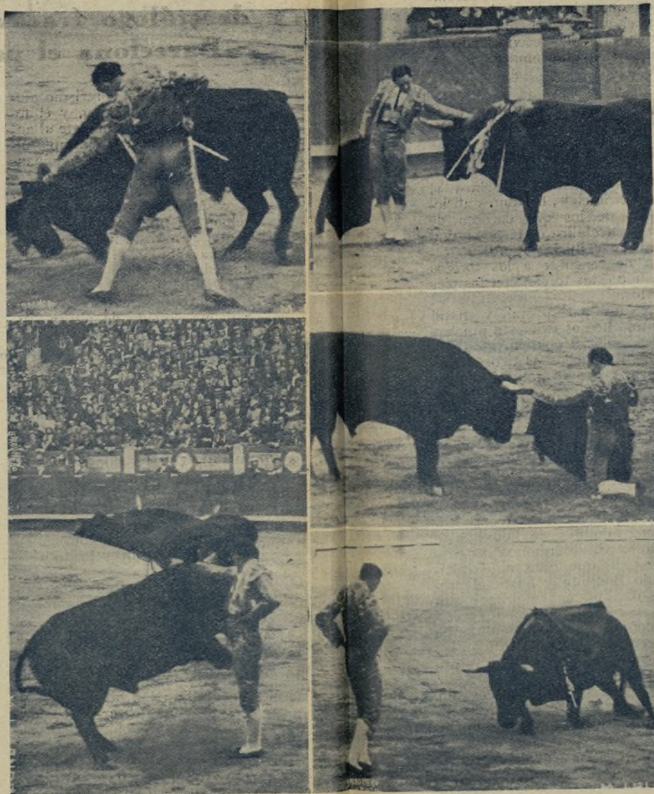
Son cinco momentos nada más. Pero cinco momentos del joven maestro valen por quinientos de «La Jaca Torera», pongamos por el diestro que más fulea lo malo que hace en los ruedos. ¡MARCIAL, eres el más grande! Por eso, cuando todos te daban por agotado, surges en Madrid y acabas con todos. ¡MARCIAL, eres el más grande!