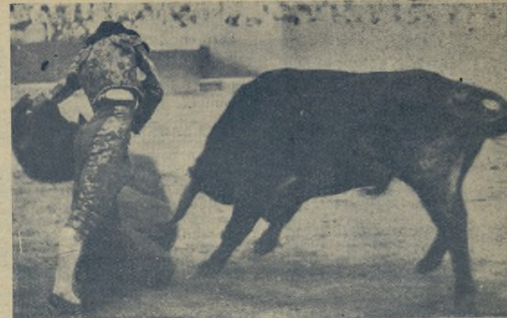
No sabe torear ni echarle gracia con el capote este artístazo de CHIQUITO DE LA AUDIENCIA, como ustedes pueden apreciar por esta foto. / Por eso y por otras cosas más, es por lo que está considerado como la figura de la actual novillería y de muchos matadores de toros que presumen bastante.

¿No les parece a ustedes que cuando se haya enterado Es-