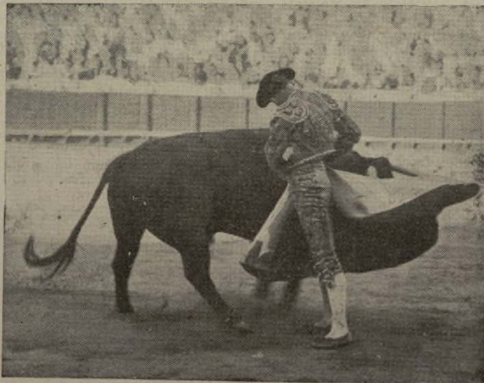
Hemos estado en Valencia y allí nos hemos enterado de que CAPILLER actuó la pasada semana y de que su toro dejó entre los aficionados una cicla de arte que no se olvidará jamás. La media verónica que aquí reproducimos lo acredita.