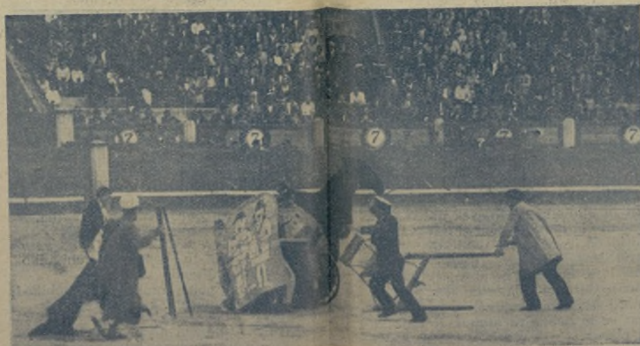
Este momento que reproducimos pertenece al genial truco que la troupe de LLAPISERA estrenó en Madrid entre grandes aclamaciones. Esta famosa agrupación de LLAPISERA prepara para la temporada próxima grandes novedades y de color para que aprecien los aficionados que a LLAPISERA no se le agota el ingenio ni se duermen en los laureles.