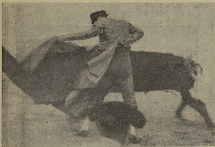
¡EL ESTUDIANTE!, el fenómeno de 1932, en un lance de frente por delante, en el que se divide al torero que manda en su enemigo con la misma facilidad que se juega una partida de mus. Ya se le disputan las empresas. Y cuando salga el toro se le disputarán los aficionados.

también se reiría Cagancho, porque tales cosas le permiten cobrar caro, alternar con los mejores, ir a las principales ferias... y venga miedo, desamprensión y la espantada libre. Los espectadores quieren eso, y él lo da, ¡y lo cobra!