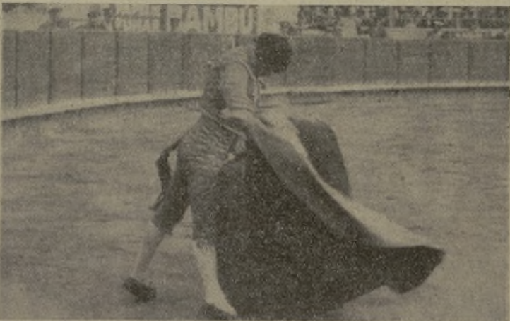
¡REBUJINA! El torero macho por excelencia, el que se la jugó en Madrid como ninguno, en una corrida en la que no cobraba un real y torcaba un toro solo. Este lance le acredita de gran artista y está ejecutado en otra tarde en Barcelona.