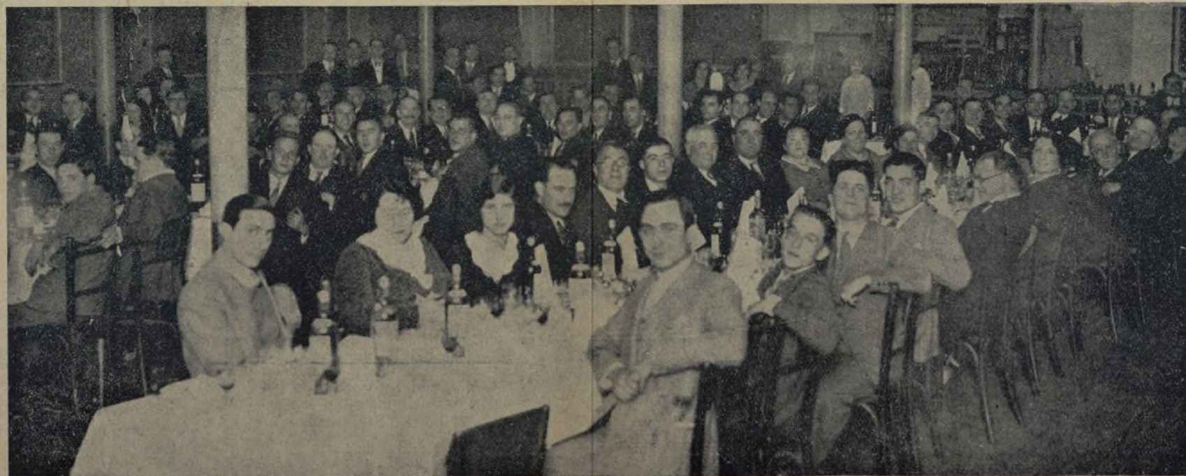
Estupendo aspecto que ofrecía el banquete-homenaje a los camaradas de «Oro y Plata», celebrado en Barcelona el pasado domingo 13 de diciembre, para conmemorar su décimo año de publicación. ¡Que vedis el cincuenta, es lo que os descan este puñado de compañeros! Pero chilen