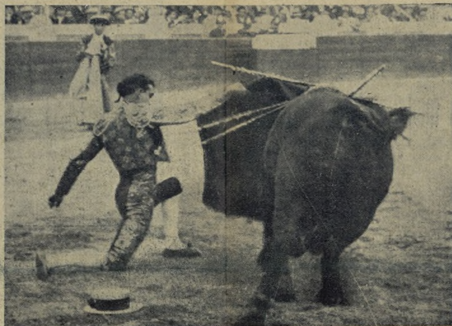
Lo es el joven maestro, que termina su temporada en Ceuta el 15 de noviembre y a los dos meses empieza la otra temporada en Alicante. Claro que forcecan do así es para no parar en toda la vida. Pase lo que pase y digan lo que quieran.

En Alicante, los días 16 y 17 de Enero, las dos primeras corridas del año, organizadas por Dominguín, en honor del Presidente de la República DON NICETO ALCALA ZAMORA