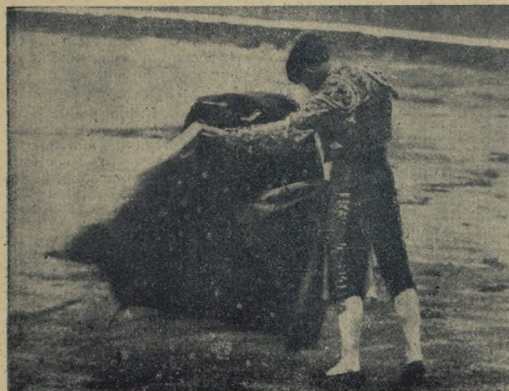
VICENTE BARRERA ha sugestionado a los mejicanos con su capotillo mágico, puesto que han visto en el diestro valenciano a otro torero muy distinto al que ellos ya conocían. Eso se llama amor propio y afición en una sola palabra. Eso que VICENTE ha marchado a Méjico a torear y no a cobrar como hacen muchos.