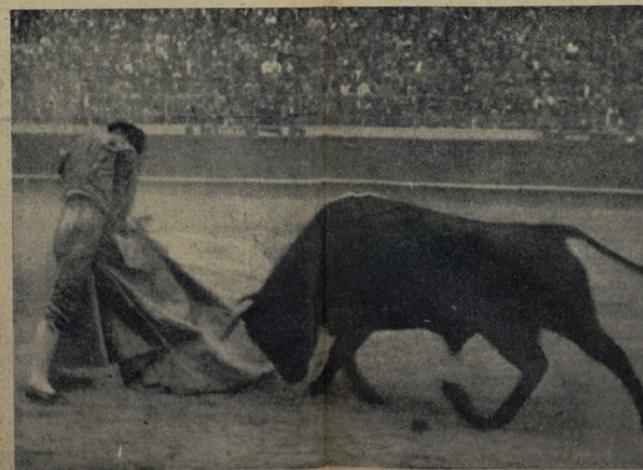
EL BRILLANTE DE BOROX, el diestro que más corridas torcó la pasada temporada, y por lo que se ve el que también llevará el gato al agua en ésta. ¡Como que este de los toros no tiene nada más que un secreto: arrojarse mucho!