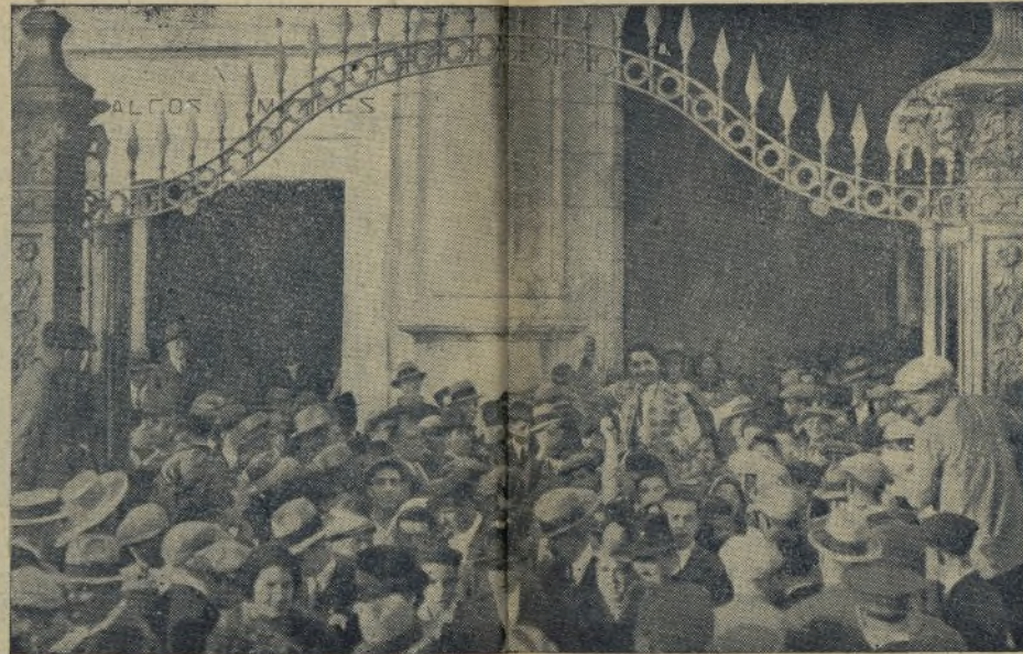
Aquí tienen ustedes a CHIKUITO DE LA AUDIENCIA saltando en hombros por la puerta grande de Sevilla. Así solo tiene explicación el que se lo disputen los empresarios para el día de su alternativa.

Don «Ciprés» Villalta se ha dedicado de nuevo a publicar una estadística de las orejas que ha cortado en la plaza de toros de Madrid. Esta estadística la hemos visto en algunos periódicos provincianos con todos los pelos y señales.