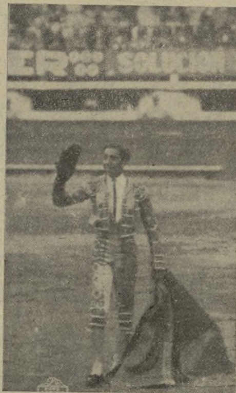
ARMILLITA CHICO, el sabio, fué rectificado en su país con una entusiástica ovación. Vedle aquí montera en mano saludando a la afición mejicana que le quiere como a la primerísima figura del toreo.

En cambio, el otro inspector, de barrenderos, también coletudo, se ha hecho «el muerto». ¡Por lo visto debe estar muy entretenido, viendo como funcionan las escobas en la vía pública!