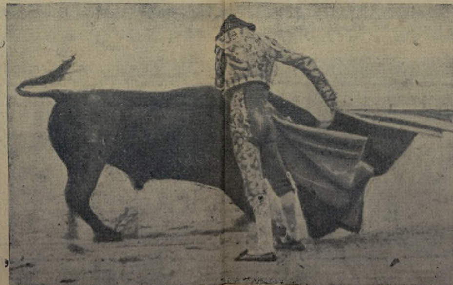
El arte, el valor, el temple y el mando que está echando EL ESTUDIANTE en esta media verónica no es capaz de mejorarlo NADIE . Por eso será el torero de 1932.