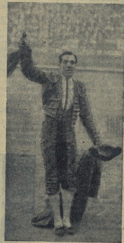
CARNICERITO DE MEJICO mostrando al respetable el galardón que le fué otorgado por los aficionados catalanes una de las tardes de sus innumerables éxitos. Hoy torcea por tercera vez en la capital mejicana, y es de esperar que añada un nuevo triunfo a su brillantísima temporada.

En su segundo, toreó magistralmente con el capote. Pusó dos soberbios pares de banderillas, y con la muleta ejecutó una faena de verdadero maestro, compuesta de pases de toda marcas, sobresaliendo uno de pe-