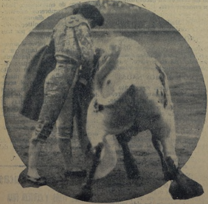
CHIQUEITO DE LA AUDIENCIA , el formidable torero madrileño, que sin presumir de torero valeroso le está echando a este lance, además de un arte insuperable, un valor extraordinario. ¡Ése es CHIQUEITO DE LA AUDIENCIA, el nuevo doctor en tauromaquia en el mes de mayo próximo de manos de Chicuelo, en Barcelona!