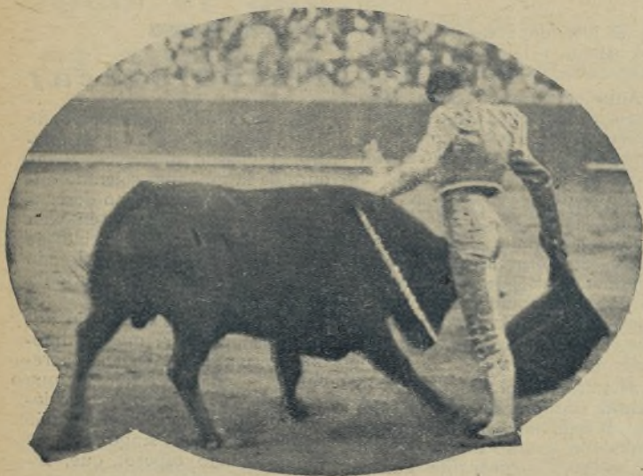
VICTORIANO DE LA SERNA , el torero que más se le va ha discutir en la presente temporada, tiene el secreto sobre los demás de un temperamento tan puramente pastueño, que al toro que le embista bien le hace lo que no son capaces de ejecutar todos los toreros juntos. ¡Por eso, LA SERNA, será el artista más discutido esta temporada!