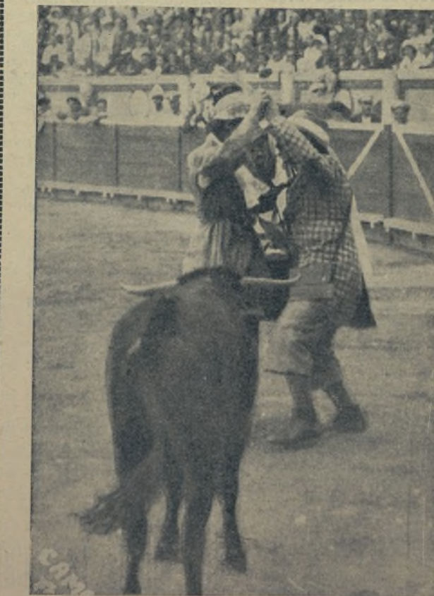
Aquí tienes, lector, a dos artistas de la Agrupación Llapsera marcándose un paso de baile, delante de uno que les puede lastimar el conjunto. Ahora que la gracia de ambos se sobrepone a la tragedia y hacen diabluras con el becerro y a los espectadores desternillarse de risa. ¡Por eso pertenecen a la Agrupación del genial Llapsera!