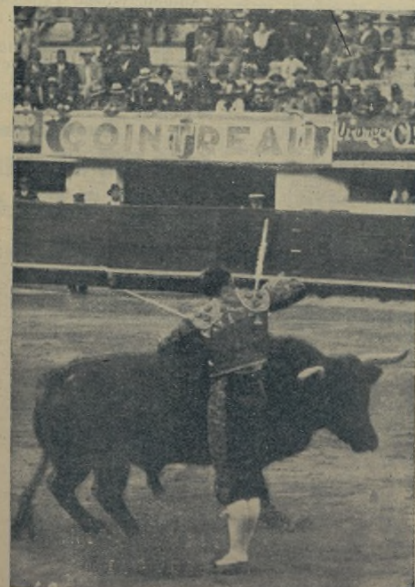
El arte y el dominio que tiene VICENTE BARREIRA con la muleta no lo tiene ningún torero. Por eso para el diestro valenciano no existen toros malos. De ahí que sus triunfos en Méjico, de donde es esta foto, tengan siempre una continuación y sus corridas sean pagadas a unas cantidades tan fabulosas, que para si las quisieran muchos de los que sus apoderados presumen en el café.