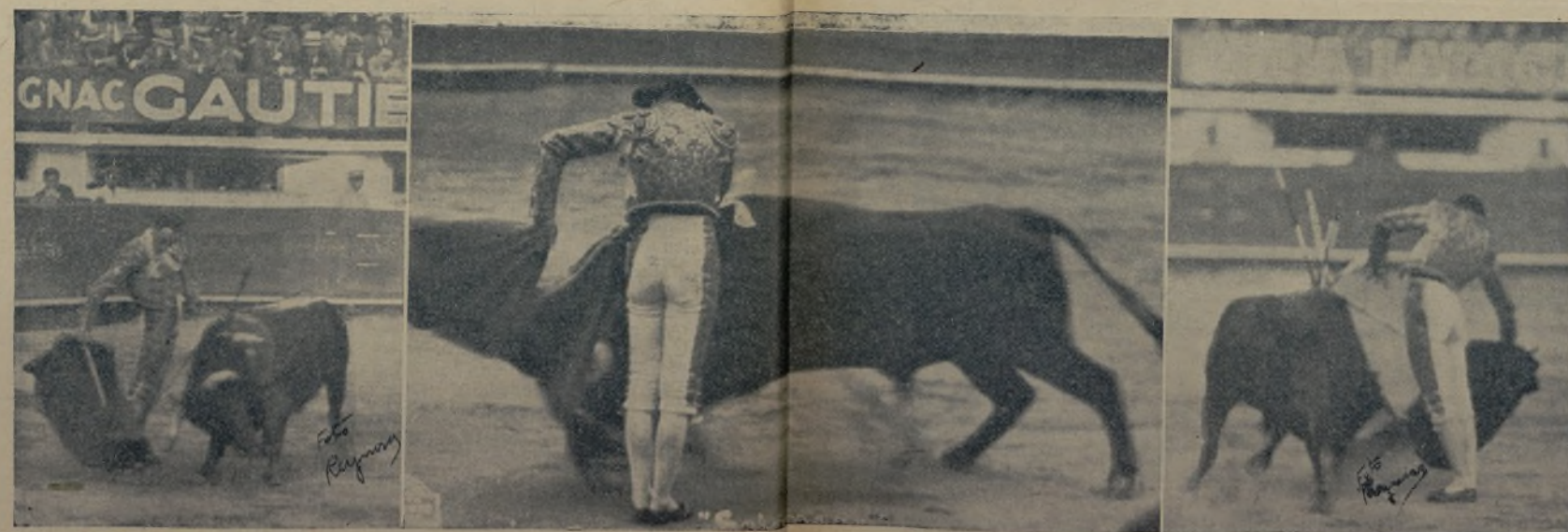
Las tres fotos que reproducimos fueron obtenidas en la tarde de su apoteosis, en la Plaza de El Torero, donde bordó con el capote y con la muleta una grandiosa tarde de toros. Por eso, CHUCHO , con esa frialdad, con esa valentía heladora, cuando le salga otro toro en Madrid como aquel célebre de Alcas, será el mejicano mandón en España.