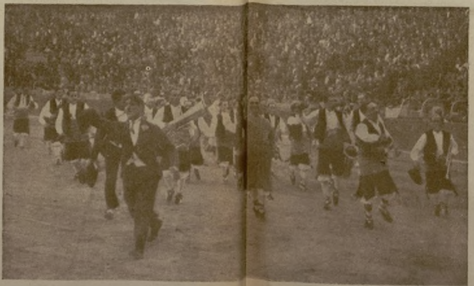
Esta alegría no la pueden tener en los pedos nada más que la Banda LOS DE ARAGON, los que tantos triunfos consiguieron la temporada pasada en España y Portugal. Mucha gente hay en el ruedo. ¡Pero qué me dicen ustedes de la que hay en los tendidos admirándolos?