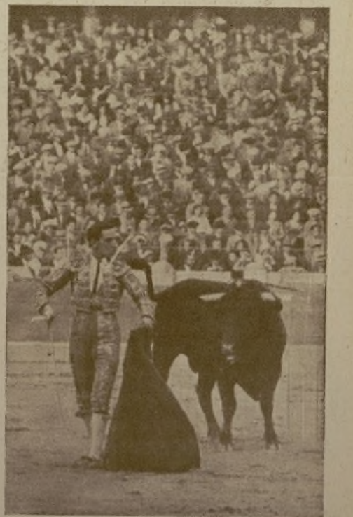
Este alarde de dominio no lo tiene nadie más que VICENTE BARRERA, el mago de la mulata, el que para él no tiene secretos ese paño rojo en la mano derecha. ¡Por eso, sus triunfos corren parejas con sus actuaciones!