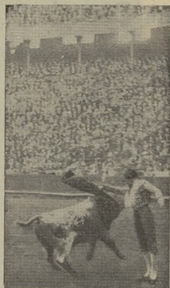
CARNICERITO DE MEJICO , el torero que no lleva nadie a la plaza, como puede verse, aún no ha puesto los «píncipes» en España. Trac un equípaje tan voluminoso que el barco no puede desarrollar toda su marcha. ¡Tiene muchos riñones este torero!

La faena de muleta con el cuarto albaserrada de la tarde fué, como la primera, una lección de jugar al toro. Había brindado en los medios, y en los medios también, como en el anterior, solo, reposado, tranquilo, alternó el natural con el afarolado, con un dominio y una seguridad que hacía desaparecer la idea del peligro... Torero de la armonía, ni descompuso la figura, ni perdió el ritmo en toda la faena, que fué de soberano maestro. El paleta de Boróx se ha convertido en el transcurso de un año en un