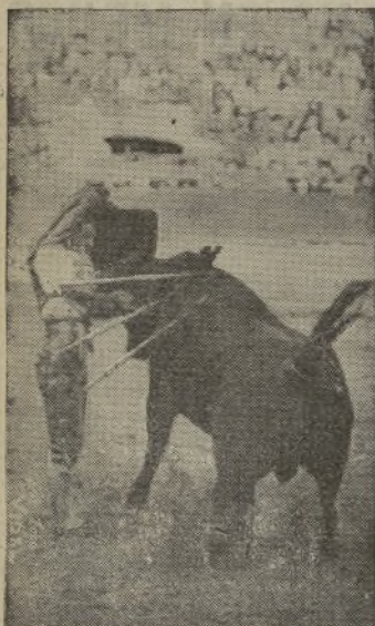
CHIQUITO DE LA AUDIENCIA , el torero del arte brujo, ejecutando con la muleta un farol de 20.000 voltios. / Si LUANITO hubiera podido tomar la alternativa en Barcelona, a estas horas CHIQUITO tendría pendiente de su palabra a las empresas de toros de las plazas más importantes. ¡A aliviarse, pollo y a ver que pasa en Jerez!